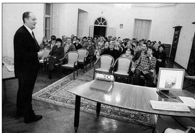
Župan je pozdravil prisotne in na kratko spregovoril o pomenu urejenosti okolja

Ob zaključku projekta "Moja dežela - lepa in gostoljubna 2004" (v petek, 5. novembra 2004) je na zaključni slovesnosti v Beli dvorani gradu v Račah župan občine Rače - Fram podelil 59 priznanj in štiri plakete nagrajencem za najlepše urejene poslovne objekte, kmečka dvorišča, urejenost ulice oz. kraja in za najlepše urejene stanovanjske hiše v občini, ki smo si jih s zanimanjem ogledali v multimedijski predstavitvi, ki je temu sledila.