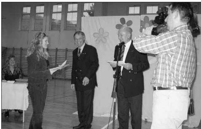
Kulturni program in podelitev LIONS priznanj

Prav zato so trije naši učenci prejeli plaketo LIONS CLUB-a za lanskoletno humanitarno in okoljevarstveno delovanje.