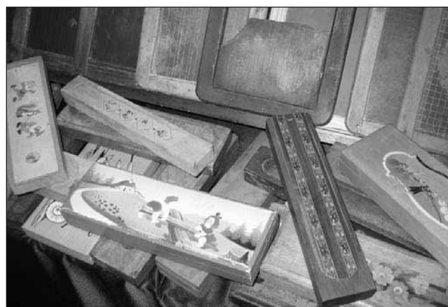
Del bogate zbirke zbiratelja šolskih starin Marjana Marinška

Ta dan je bil res dan doživetij in drugačnosti. Veseli smo, da nam je uspelo združiti staro z novim, preteklo stoletje s sedanjim.