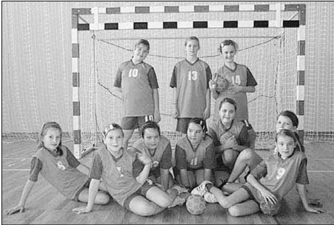
Deklice mini rokometna letnik 98 in mlajše - OŠ Rače

Dve skupini deklic letnik 1998 in mlajše tekmujejo v mini rokometni ligi skupine Ptuj. Ena izmed teh skupin deklic obiskuje OŠ Rače, druga OŠ Starše. Vadba teh skupin je že nekoliko zahtevnejša, ker se deklice pripravljajo, da bodo v sezoni 2009/10 igrale kot mlajše deklice B v državnem prvenstvu.