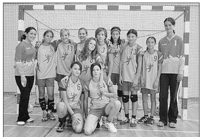
Ekipo RK Rače - starejše deklice

Če vas bo ta informacija preko Novic morda uspela ujeti še pravočasno, vas vljudno vabimo, da se te odločilne tekme udeležite - pridite in navijajte za našo ekipo.