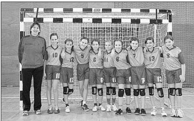
Deklice mini rokometna letnik 98 in mlajše - OŠ Starše

Za to starostno obdobje je pomembno, da deklice spoznavajo šport in njegove značilnosti: pravila, igrišče, rekvizite. Prav tako je pa zelo pomembno, da razvijejo navade in način ravnanja: odnos do športa - mini rokomet, odnos do soigralcev, tekmecev in sodnikov, odnos do sprejemanja zmage in poraza, kontrolirano reagiranje v konfliktnih situacijah. Pomembna je krepitev medsebojne pomoči in sodelovanja, samozavesti, borbenosti ter vztrajnost. Razen teh osnovnih elementov ne gre zanemariti še veliko drugega, kar je sestavni del kolektivne igre. Morda je še najlažje otroke naučiti osnov rokomet, veliko težje pa je razviti skupinski duh, ki je nujno potreben, da se lahko izgradi uspeh v kolektivnih športih. V svetu, kjer prevladuje individualizem, kjer so otroci vedno bolj razvajeni, odtujeni in zaverovani vase, jih je težko prepričati, da bodo uspešni le v sodelovanju z drugimi. Tako kot je v življenju pomembno sodelovanje, vztrajnost in nepopustljivost, je v skupinskem športu ta potreba še toliko bolj izražena.