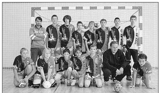
Ekipo Starejši dečki RK Rače

V tej skupini so imeli do sedaj le dve tekmi; na domačem terenu so nasprotnike premagali, na gostovanju pa so tekmo, žal, izgubili. Naslednjo tekmo bodo igrali v domači dvorani - v športni dvorani v Račah, 7. marca 2009, z RK Moškanjci - Gorišnica.