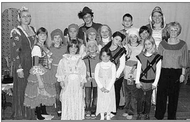
Celotna zasedba igralske ekipe ob zaključku predstave

Gledališka skupina je zaigrala dramo še ob 8. marcu in jo poklonila dnevu žena v naši občini. Ponovne uprizoritve bodo potekale v mesecu novembru in decembru letošnjega leta.