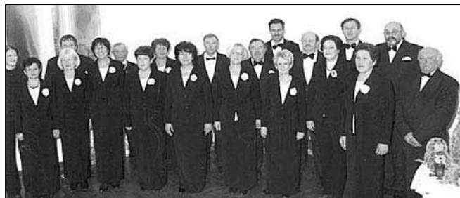
MePZ KD Rače na otvoritvi prireditve "Moja dežela - lepa in gostoljubna 2008"

študirajo nove pesmi in se tako pripravljajo na bodoče koncerte. Leta 2008 so, kljub izgubi svojega dotedanjega dolgoletnega zborovodje Iva Partliča, uspešno zaključili svojo pevsko sezono.