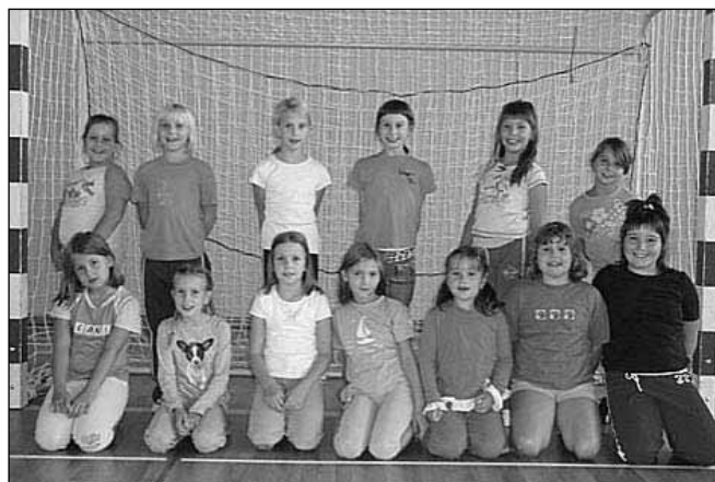
Deklice mini rokometna letnik 2000

Naša najmlajša skupina je ekipa deklic mini rokometna na OŠ Rače, ki obiskujejo 3. razred, torej so rojene v letu 2000. Skozi igro se družijo, učijo večščin in spoznavajo pravila rokometne igre.