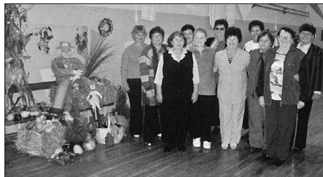
Članice ročnodelskega krožka "Unikat"

Na razstavi, ki je trajala dva dni, smo prikazale izdelke iz lesa, suhega cvetja, tkanin, kamenja, maha, stekla ipd.