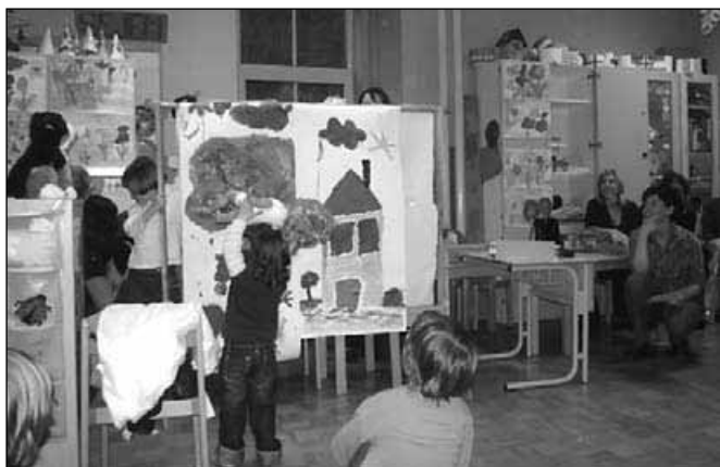
Pedenjsrečanje je poskrbelo za obilico ustvarjalnega navdiha

Po približno tridesetih minutah smo se združili in vsaka skupina je predstavila svojo aktivnost v posameznih koticah.