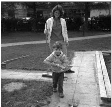
Naš najmlajši udeleženec čistilne akcije

Naš vrtec se je 17. aprila z veseljem priključil vseslovenski čistilni akciji "Očistimo Slovenijo v enem dnevu". Na sobotno jutro smo se v lepem številu zbrali pred vrtcem – zaposleni ter naši malčki in njihovi starši, ki so nam z obilico dobre volje pomagali očistiti okolico vrtca.