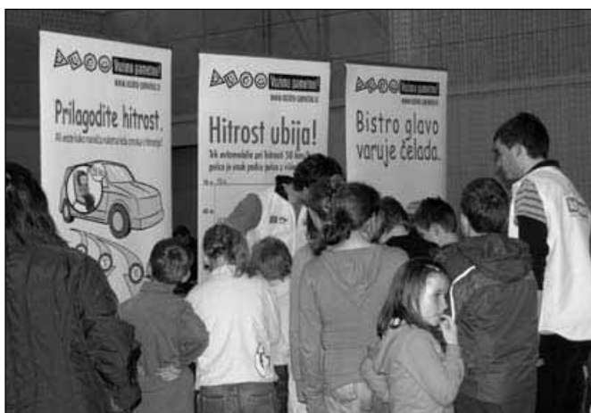
Otroci preizkušajo varnostne sedeže

Po zaključku programa so se starši in otroci pridružili predstavnikom Sveta za preventivo in vzgojo v cestnem prometu in jim prisluhnili. Otroci so preizkušali varnostne sedeže in se zabavali z maskoto Pasavček.