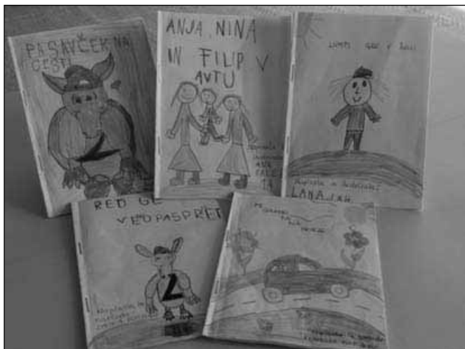
Knjige, ki so jih ustvarili otroci v projektnem tednu