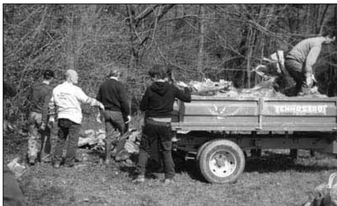
Nalaganje in odvoz odpadkov

Akcija je bila več kot uspešna in okoli 15. ure smo bili enotnega mnenja, da smo si pošteno zaslužili nekaj za pod zob. Malica v gostišču Meglič je zato izredno teknila.