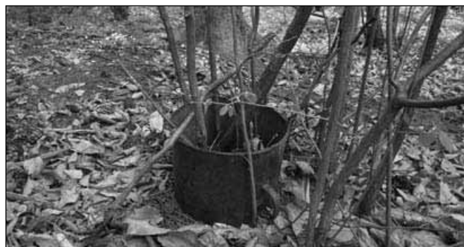
Neverjetno, tudi v gozdu drevesa rastejo v »okrasnih« loncih...