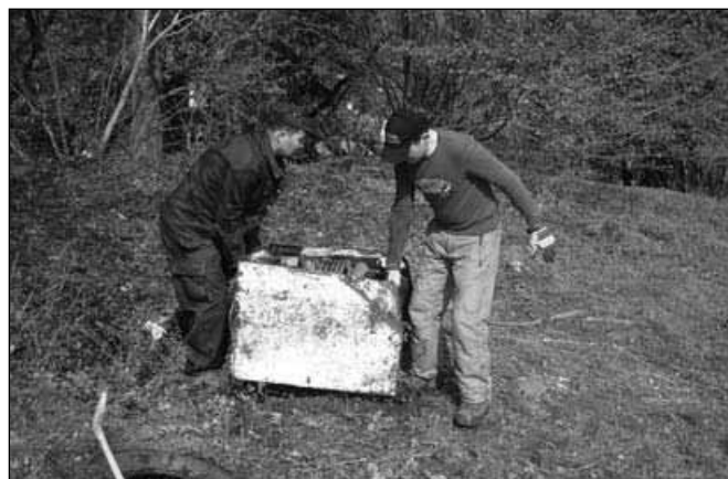
Smeti, smeti, vsepovsod smeti...