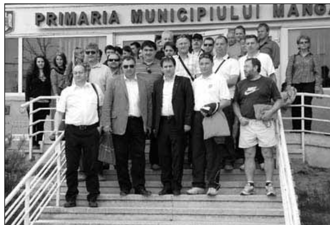
Skupinski posnetek starih in novih prijateljev

S predvidenim ponovnim srečanjem v Sloveniji se bodo ti odnosi še okrepili in če poznamo mentaliteto ljudi Romunije, lahko z vso gotovostjo zatrdimo, da je to prvi korak k uspešnemu poslovnemu sodelovanju v prihodnosti.