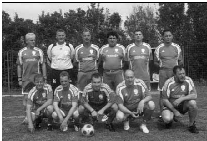
Optimistično razpoloženi člani slovenske nogometne ekipe