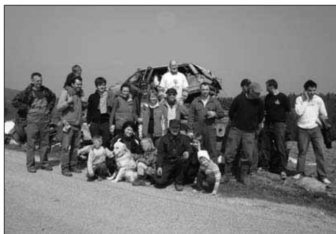
Zadovoljni na koncu uspešne akcije

Akcija je bila več kot uspešna in okoli 15. ure smo bili enotnega mnenja, da smo si pošteno zaslužili nekaj za pod zob. Malica v gostišču Meglič je zato izredno teknila.