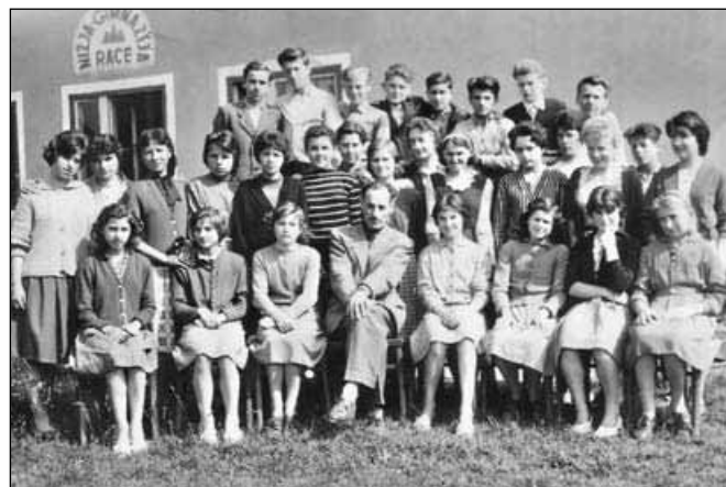
Fotografija izpred pol stoletja; nekdanji sošolci nižje gimnazije v Račah, ko smo še guli šolske klopi