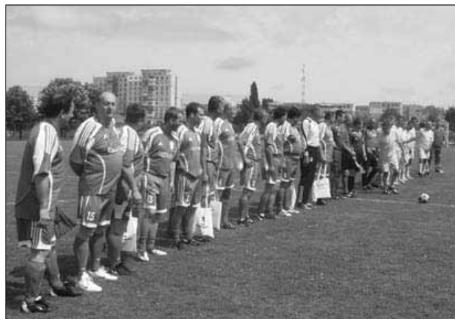
Nogometni ekipe pred začetkom tekme

V popoldanskem času se je druženje nadaljevalo s prijateljsko nogometno tekmo, ki se je končala z izidom 5:2 za domačine. Prepričani smo, da bo boljše na povratni tekmi jeseni v Sloveniji.