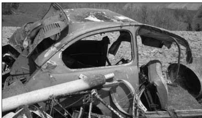
Tudi takšnim prizorom smo bili priče...

Še dobro, da smo imeli traktorje s prikolicami, kajti smeti je bilo zares ogromno! Nabrali smo jih za skoraj 100 m 3 in Snaga jih je morala odpeljati s kar dvema velikima avtomobiloma.