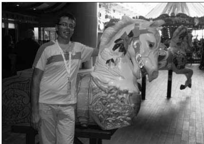
Avtor prispevka v impozantnem plavajočem hotelu

Potnike razvaja na 16 palubah, do katerih jih vodi 24 dvigal, v 2700 kabinah, ki so razvrščene na različne kategorije, pa lahko sprejme od 5400 (dvojna zasedenost kabin) do 6300 potnikov in 2165 članov posadke, ki prihajajo iz več kot 70 držav sveta.