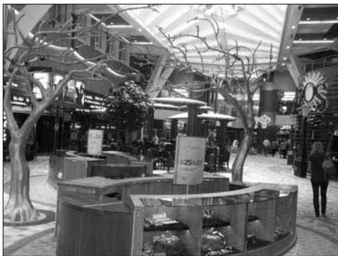
Royal Promenade na ladji

Na krovu ladje se nahaja tudi Royal Promenade, kraljeva promenada s številnimi bari, trgovinami, dvigajočim se barom, fontanami, recepcijo in drugimi zanimivostmi, kjer najdemo gledališče Opal z več kot 2100 sedeži, drsališče, glavno restavracijo, ki lahko hkrati sprejme kar 3056 gostov. Za odlično postrežbo in pripravo hrane je zaposlenih več kot 220 kuharjev in 500 natakarjev, ki vam postrežejo pijačo ali obrok hrane v kar 108 gostinskih obratih.