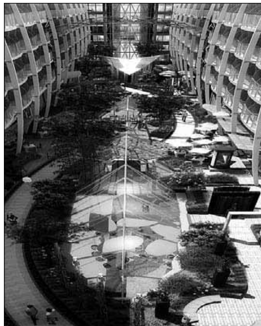
Soseska Centralni park na ladji

restavracijo Central park 150, ki navdušuje z renomiranimi italijanskimi in drugimi kulinaričnimi razvajaji.