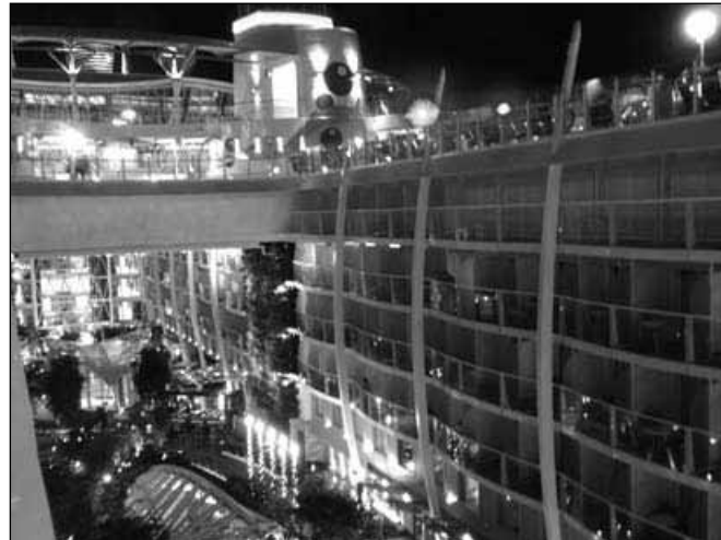
Nočni pogled na del največje križarke na svetu; med sprehodom po centralnem parku

Park obdaja 334 kabin, ki se dvigajo 6 palub visoko, od tega jih ima 254 svoj balkon s pogledom na park.