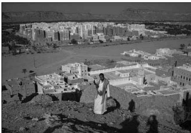
Jemen ostaja v nepozabnem spominu...

To je država iz nekega drugega časa, država, ki v vsakem popotniku pusti neizbrisen pečat, prav tako kot prva ljubezen, ki je nikoli ne pozabiš.