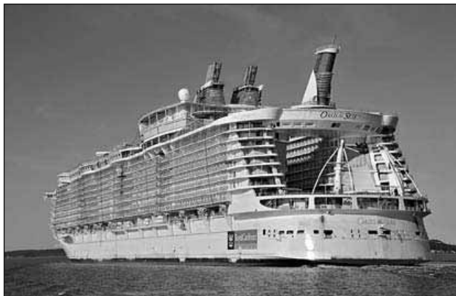
Oasis of the Seas

Ladjo Oasis of the Seas so začeli graditi februarja 2008 na Finskem, v ladjedelnici Turku. Sestavljalo jo je več kot 1000 delavcev. Ladja preseneča v vseh ozirih. Dolga je 360 m in široka 64 m, njena višina je 65 m, teža je 220.000 BRT.