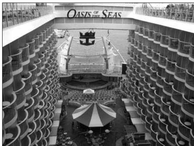
Boardwalk na ladji

Na krovu ladje se nahaja tudi Royal Promenade, kraljeva promenada s številnimi bari, trgovinami, dvigajočim se barom, fontanami, recepcijo in drugimi zanimivostmi, kjer najdemo gledališče Opal z več kot 2100 sedeži, drsališče, glavno restavracijo, ki lahko hkrati sprejme kar 3056 gostov. Za odlično postrežbo in pripravo hrane je zaposlenih več kot 220 kuharjev in 500 natakarjev, ki vam postrežejo pijačo ali obrok hrane v kar 108 gostinskih obratih.