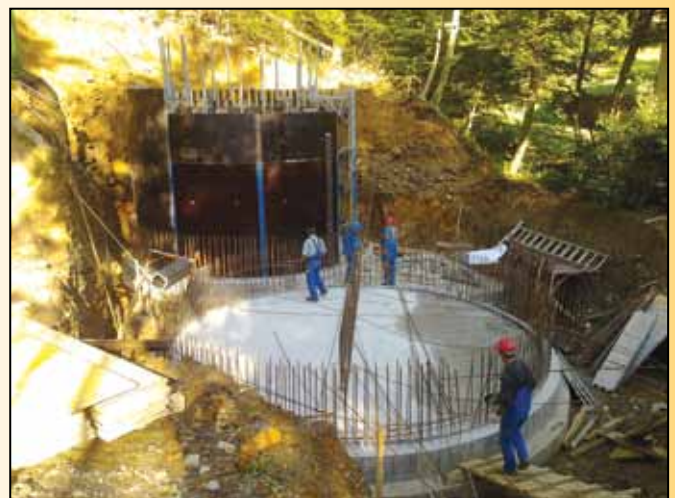
Izgradnja vodohrana v Framu

V času priprave tega članka so v teku pripravljala dela za rekonstrukcije in razširitve naslednjih lokalnih cest in ulic: