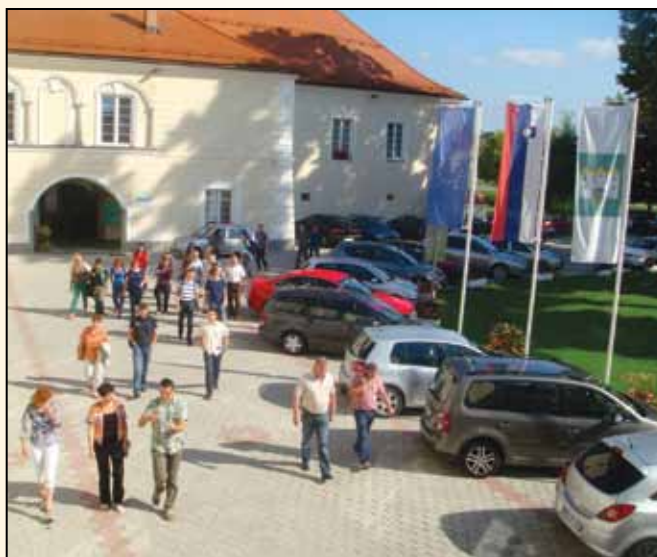
Sprejem predstavnikov SVRL pred gradom Rače

Objekt je z obnovo pridobil na videzu, v novejšem času mu je bila dana dodatna vsebina – tržnica, predvsem nova streha pa prispeva k ohranjanju kulturne dediščine. O dosegu v dokumentu identifikacije investicijskega projekta zastavljenih ciljev so se predstavniki vladne službe pričeli na delovnem obisku pri nas, 2.8.2011.