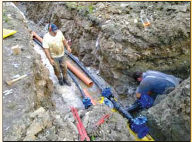
Prevezava vodovodnega sistema v Framu

omrežju v Račah smo zaradi preobremenjenosti mešanega fekalnega sistema v času obilnih padavin izvedli dodatnih pet razbremenilnikov. Novogradnja vodohrana v Framu poteka v skladu z zastavljenim terminskim planom in bo zaključena predvidoma do 15. oktobra 2011.