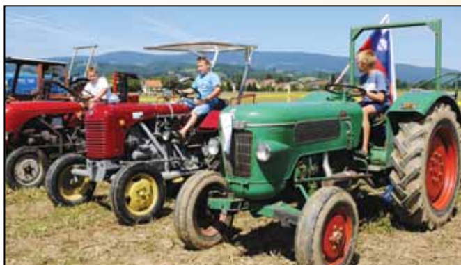
Razstava starodobnih kmetijskih strojev in na njih mladi rod – up za prihodnost kmetijstva