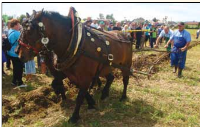
Župan Občine Rače-Fram Branko Ledinek med oranjem s konjsko vprego