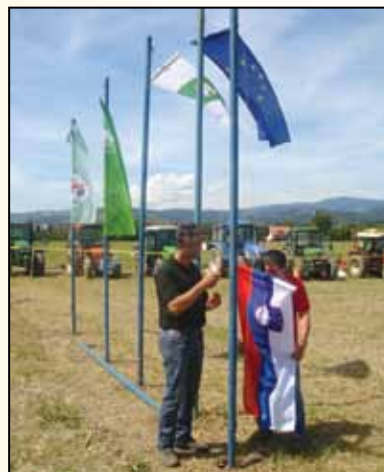
Čast slovesnega dviga slovenske zastave, s čemer se je tekmovanje pričelo, je pripadla lanskoletnima zmagovalcema