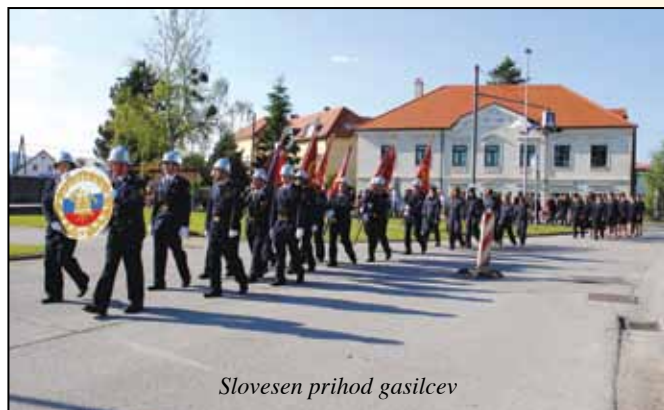
Slovesen prihod gasilcev

Pred zaključkom pa še nekaj fotografij s slovesnosti ob 125-letnici delovanja PGD Rače, 11.6.2011: