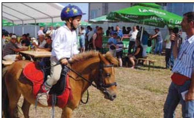
Predstavitve jahalne šole Bregant iz Orehove vasi