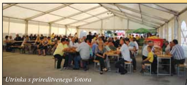
Utrinka s prireditvenega šotora