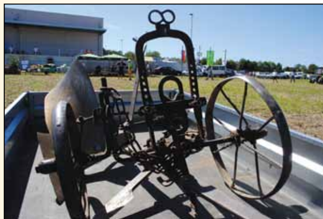
Prizora, kot ju je dandanes v naravi mogoče videti le še izjemoma