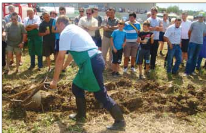
Naš župan je dokazal, da kar se »Janezek nauči, to Janez zna«...