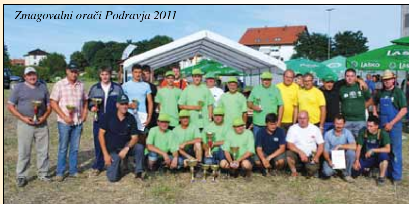
Zmagovalni orači Podravja 2011