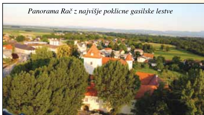
Panorama Rač z najvišje poklicne gasilske lestve