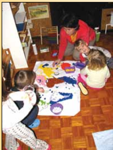
Skozi igro do zemljevida sveta