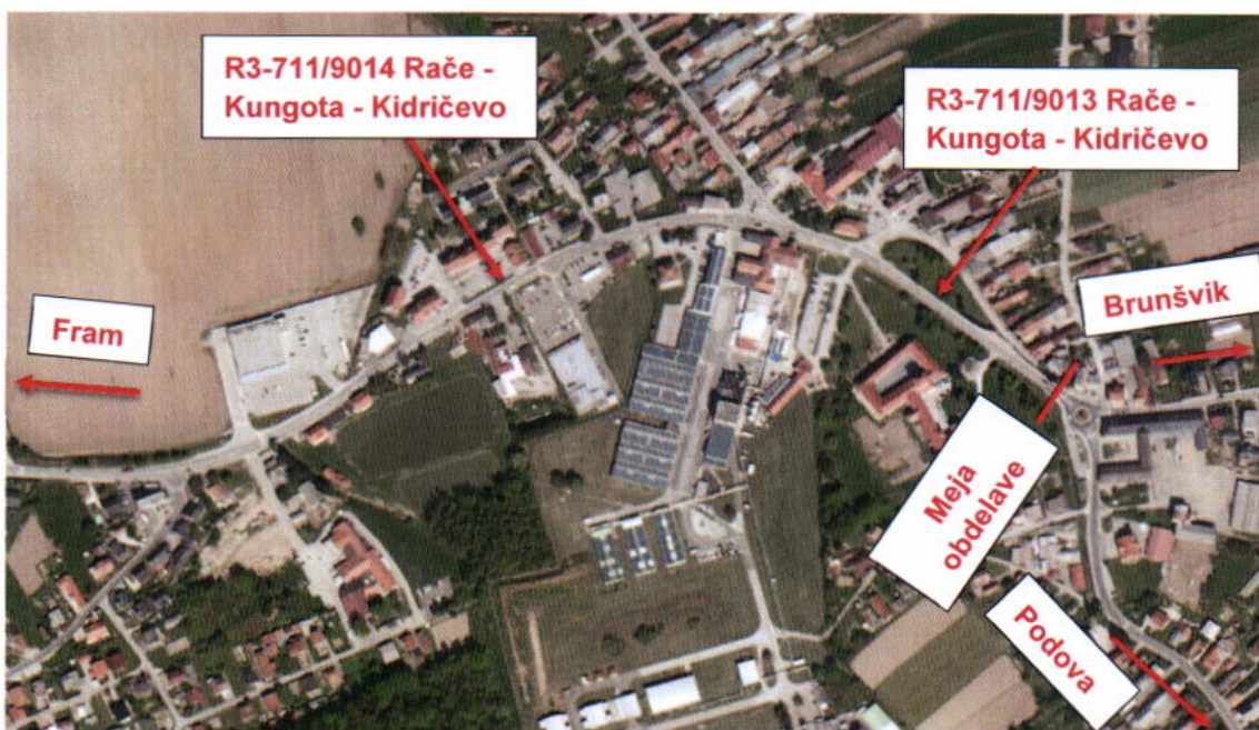
Slika 2: Regionalna cesta R3-711/9014 Rače – Kungota - Kidričevo od km 0+000 (križišče Ljubljanske ceste in ulice Bratov Turjakov) do km 0+569 (križišče Ljubljanske in Mariborske ceste) in regionalna cesta R3-711/9013 Rače – Kungota – Kidričevo od 0+000 (križišče Ljubljanske in Mariborske ceste) do km 0+250, obstoječe krožišče;