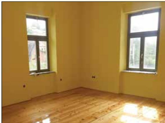
Prenovljena učilnica, obsijana s soncem, vabi

V marcu smo začeli z urejanjem prostora, nabavo opreme in pripravo programov. Vrata smo odprli junija in vabimo vas, da nas obiščete na Turnerjevi ulici 107 - v rumeni zgradbi zraven gasilskega doma. Vabljeni radovedni osnovnošolci, srednješolci ter mladi in odrasli, ki vas zanimajo tehnika, tehnologija in naravoslovje.