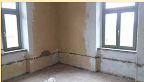
Prostori na Turnerjevi ul. 107 v Framu na začetku projekta

K partnerstvu smo pritegnili še Občino Rače-Fram, Orodjarstvo Gorjak iz Rač in Zavod SiOK iz Slovenske Bistrice. Pripravili smo projekt 'Vzpostavitev centra Modra delavnica - od poskusa do poklica', ki je bil na prvem pozivu izbran za sofinanciranje. Prostor v središču Frama in delno urejanje le-tega (elektrika, podi in vodovod) je prispevala Občina Rače Fram, Orodjarstvo Gorjak bo otrokom in mladim omogočilo spoznavanje poklicev v orodjarstvu preko tehniških dni, poklicnega preizkusa in programa ABC orodjarstva, SiOK pa bo razvijal nove metode učenja za mlade in pristope pri delu z ranljivimi skupinami.