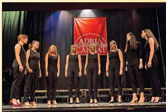
VS Virtus; Šibenik, 19. 5. 2018