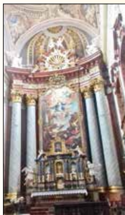
Notranjost cerkve v Monoštru

Spoznali smo tudi muzej Avgusta Pavla, kjer je obiskovalcem na ogled stalna razstava 'Slovenci na Madžarskem'.