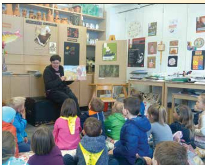
Aktivno poslušanje otrok v Pionirski knjižnici Maribor