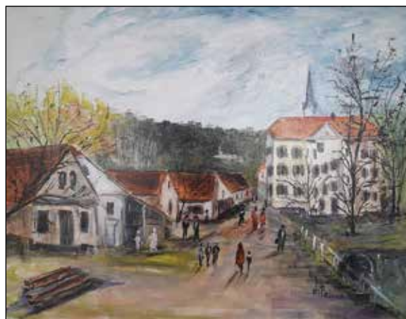
Fram, kot ga je slikarsko upodobila krajanka Anka Pečovnik