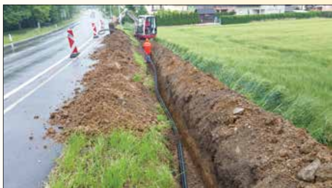
Polaganje vodovodne cevi ob Bistriški cesti v Morju