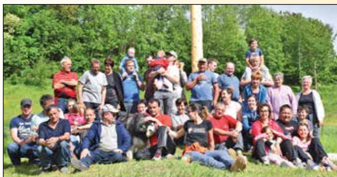
Tudi Lokmirčani nadaljujejo tradicijo postavitve majskega drevesa in druženje ob prazniku dela

Pred nami je čas dopustov in počitnic. Zajemimo poletje z veliko žlico in se prepustimo dogajanjem, o katerih bomo poročali naslednjič.