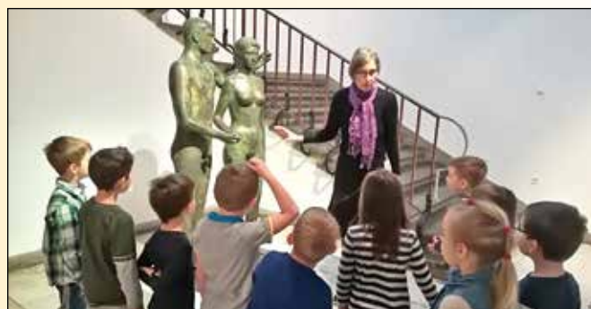
Ob kipih naravne velikosti