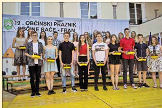
Spominski skupinski posnetek najboljših devetošolcev - prejemnikov zlatih županovih petic