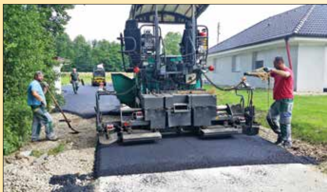
Obnova lokalne ceste v Zgornji Gorici

Na osnovi izvedenega javnega razpisa bo najugodnejši ponudnik (Podjetje za gozdne gradnje in hortikulturo d.o.o.) predvidoma do konca meseca avgusta na novo asfaltiral, preplastil ali po izgradnji kanalizacijskega omrežja saniral sedem odsekov občinskih cest v Spodnji in Zgornji Gorici, Framu, Rančah in Kopivniku.