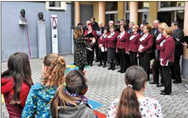
Kot se za slovesnost spodobi, ni manjkalo petja