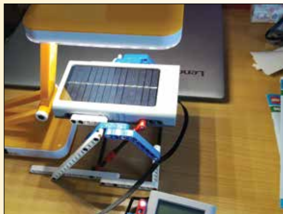
Preučevanje alternativnih virov energije s pomočjo LEGO Education

V prostorih 'Modre delavnice' boste našli zanimivo in predvsem uporabno tehnologijo - 3D tiskalnik, laserski gravirni stroj, LEGO Mindstorms (roboti) in druge LEGO Education komplete, računalnike in tablične računalnike s programi za 3D modeliranje in daljinsko upravljanje z roboti, delovne stroje in orodje za oblikovanje izdelkov iz lesa, kovine, plastike in drugih materialov, peč za glino in lončarsko vreteno, šivalni stroj, veliko tablo za poučevanje in načrtovanje - v glavnem vse, kar majhni in veliki mojstri potrebujejo pri uresničevanju svojih idej in ciljev. V naših prostorih se bo nahajala tudi kuhinja, kjer bodo potekali kuharski tečaji.