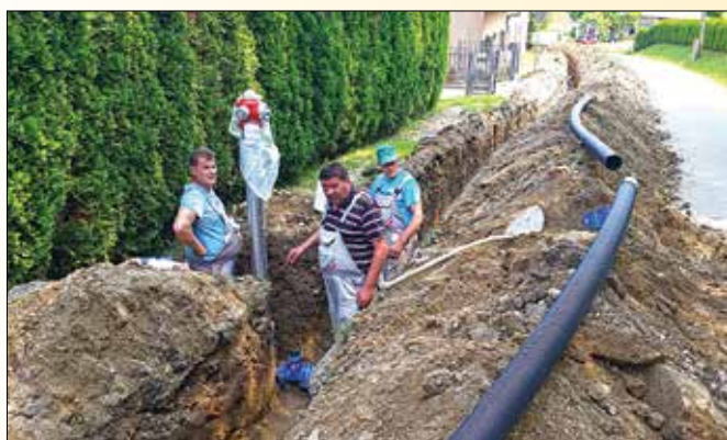
Širitev javnega vodovodnega omrežja z montažo hidranta v Požegu

Konec meseca maja je potekel rok za oddajo ponudb na javni razpis za izgradnjo kanalizacije za odpadne vode v delu naselja Ješenca. Prav v času pisanja tega članka potekata preverjanje zbranih ponudb in postopek izbire najugodnejšega ponudnika. Gre za dveletno investicijo, ki bo zajemala gradnjo fekalnih kolektorjev z dvema črpališčema odpadnih vod. Vrednost investicije je ocenjena na 550.000,00 EUR. Z deli želimo začeti takoj po podpisu pogodbe z najugodnejšim izvajalcem in dela v celoti zaključiti sredi leta 2019.