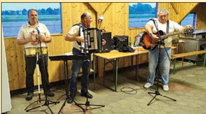
Tudi brez domačih glasbenih veseljakov ni šlo

Okrepčani smo nadaljevali z aktivnostmi na prostem. Tekme ekip (nogomet na travi, odbojka na mivki in nogomet na asfaltu) so imele dvojni sijaj – sijaj ponosa v nas in sijaj reflektorjev nad nami.