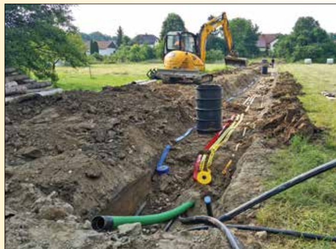
Izvedba komunalne infrastrukture v delu Gortanove ulice v Račah

V maju in juniju zaključujemo zamenjavo še zadnjih metrov dotrajanih salonitnih vodovodnih cevi v ulici Ob železnici in na Ljubljanski cesti v Račah. V sklopu navedenih gradbenih del smo na omenjenih odsekih na novo namestili oporišča javne razsvetljave ter položili TK in energetske vode. Prav tako smo na delu Gortanove ulice v Račah položili javno vodovodno in kanalizacijsko omrežje ter sopoložili telekomunikacijske in energetske (elektrika in plin) vode.