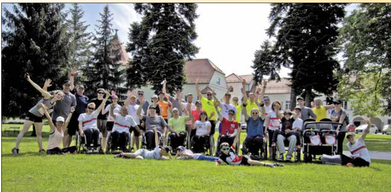
Teka v Račah se je udeležilo okoli trideset tekačev

Med 35 prijavljenimi tekači, od katerih se jih je teka udeležilo 29, je bilo v Račah tudi 7 udeležencev na invalidskih vozičkih.