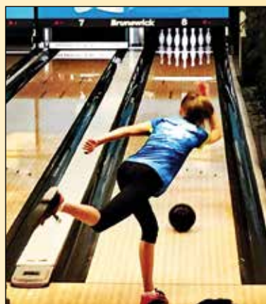
Uradna fotografija meta na evropskem mladinskem prvenstvu (Danska, Aalborg)