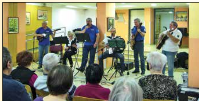
Glasbena skupina DUR; nastop v Sončnem domu na Pobrežju

Leto, ki je za nami, je bilo zelo pestro in zanimivo. Sodelovali smo na različnih prireditvah v našem kraju in izven njega. V letu 2017 smo nastopali 15 krat. Naj pri tem omenim, da smo lanskega junija izvedli dobrodelni koncert in nanj povabili goste. V avgustu smo se prvič predstavili v mestnem parku Maribor (na promenadnem koncertu). Precej smo nastopali tudi po domovih za starejše občane, kjer smo z izbranimi melodijami popestrili urico njihovega vsakdanjika. Bili so presrečni in hvaležni za to gesto, kar so potrdili tudi z bučnim aplavzom in povabilom na ponovno snidenje.