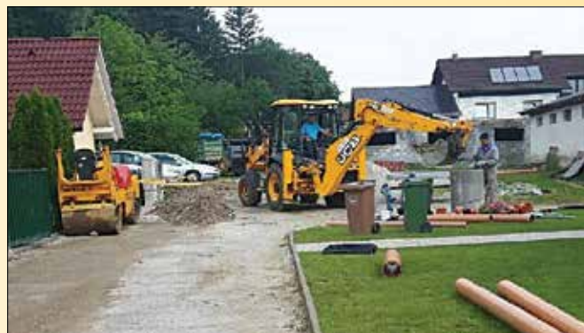
Širitev javnega kanalizacijskega omrežja v delu Priolove ulice v Morju

odlivanje maščob in raznih odpadnih olj, odvržene poveje ipd.), ki vanjo nikakor ne spadajo ter povzročajo ogromno preglavic biološkim čistilnim napravam in črpališčem.