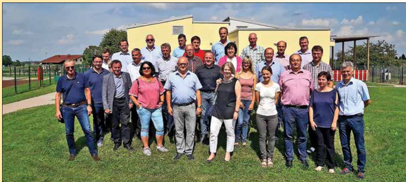
Utrinki z obiska avstrijskih županov v Račah

Veseli smo, da lahko našim predšolskim otrokom zagotavljamo pogoje za zdravo, varno, prijazno in v vseh ozirih (vsaj) optimalno vrtčevsko varstvo in vzgojo. Ob tem za mlade družine prav gotovo ni zanemarljivo, da jim je to na voljo za ceno, ki je nižja kot v večini drugih slovenskih občin.