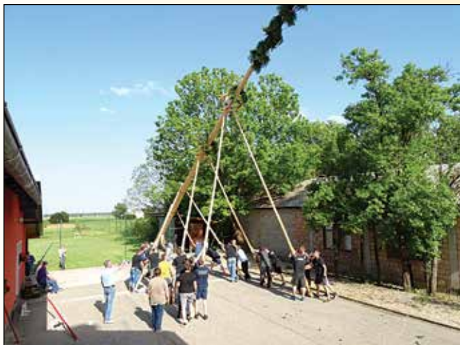
Postavljanje majskega drevesa po starih običajih