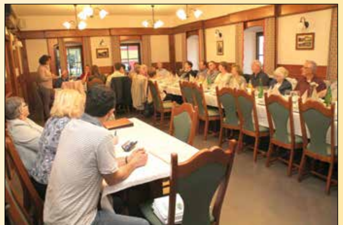
Članstvo na občnem zboru