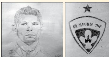
Tudi mi dihamo za vijolične!

Ob koncu smo mu vsi skupaj zaželeli obilo bojevitosti in zmagovite igre na nogometnih zelenicah.