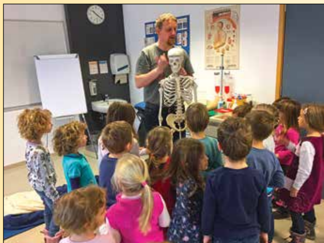
Osnovno spoznavanje zgradbe človeškega telesa

Druga skupina otrok je medtem spoznavala človeško telo. Srečali smo se z okostnjakom in organi v telesu.