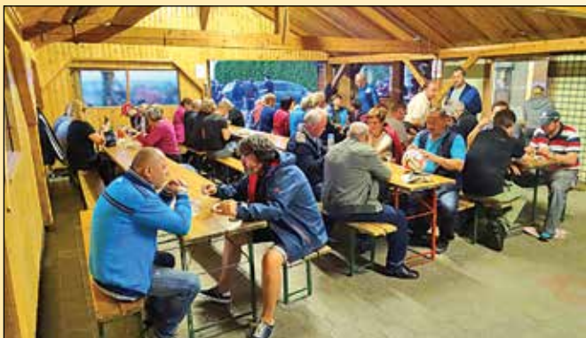
Zbrana družina ob jedači in pijači

Po uradnem delu je sledila pogostitev za vse prisotne, ki je ob glasbeni spremljavi še bolj teknila.