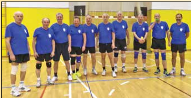
Udarna odbojcarska sekcija v sezoni 2017/18

Naši odbojkarji radi igrajo, se rekreirajo in tudi tekmujejo. Prepričani smo, da bo tudi v bodoče ostalo tako.