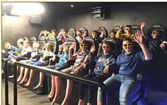
Mladi nogometni upi so kar se da pridno trenirali, prosti čas pa si zapolnili s številnimi drugimi zanimivimi aktivnostmi, ki jih v Termah Olimje ponujajo svojim gostom

Priprave smo zaključili zelo uspešno in se že veselimo prihodnjih, ki jih načrtujemo v še širšem obsegu.