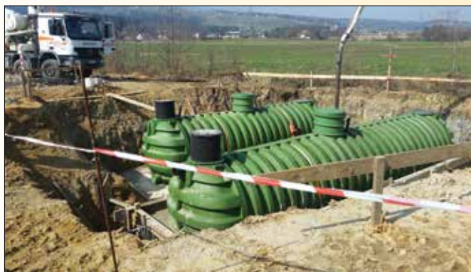
Vgradnja biološke čistilne naprave za del naselja Požeg