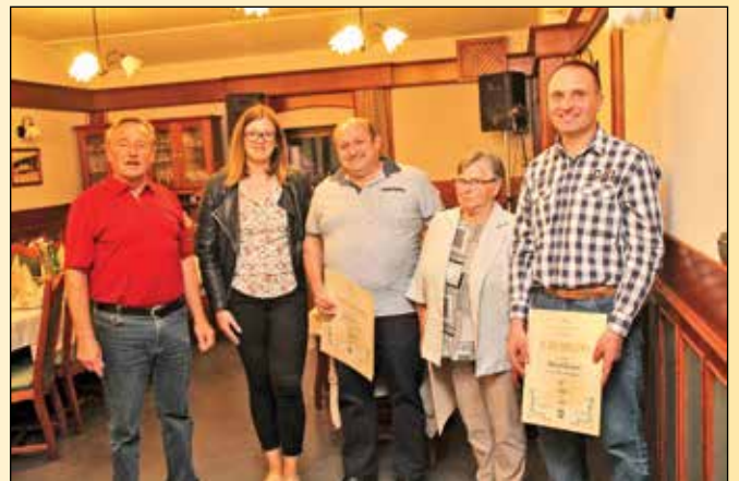
Del prejemnikov diplom za vino letnika 2017

Vsem prejemnikom diplom iskreno čestitamo! Dosežene ocene naj bodo tudi v prihodnje spodbuda in usmeritev za nadaljnje delo vinogradnikov - kletarjev za pridelavo še boljših vin v prihodnje.