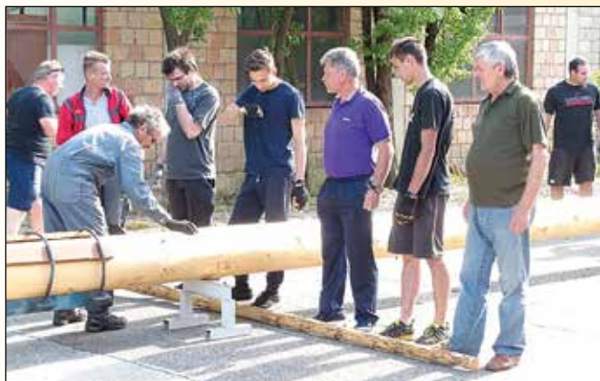
Ekipa je pripravljena na postavljanje mlaja

V nedeljo, 30. 4. 2018, smo se v velikem številu zbrali pred gasilskim domom, saj je postavitev majskega drevesa pomemben dogodek za naši vasi – Brezulo in Podovo. Dvig mlaja izvajamo še po starih običajih, na klasičen način, torej s pomočjo lesenih podpornikov ('žvaplov') in seveda z napenjanjem vseh fizičnih sil naših močnih gasilcev in drugih vaščanov.