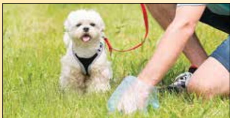
Pravilno ravnanje lastnika psa

Čeprav drobnim pasjim tačkam in tudi konkretnim šapam sprehod po zelenici seveda ni prepovedan, bi bilo prav, da bi sprehajalci za svojimi štirinožnimi prijatelji spravno počistili iztrebke.