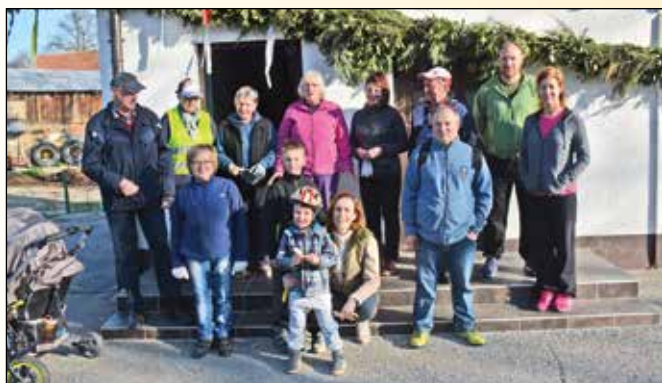
Člani društva pred domom krajanov Kopivnik; na dan letošnje čistilne akcije

Ker si prizadevamo za lep videz kraja in prijetno bivanje v njem, pozornost posvečamo tudi čistosti naše vasi. Vedno pa se najde kdo, ki ekološko še ni dovolj osveščen, zato se vsako leto zberemo na čistilni akciji.