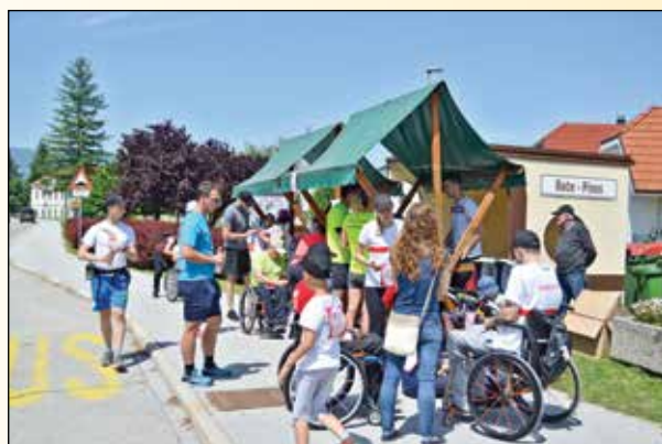
Start teka je bil izpred avtobusne postaje pri gradu v Račah, trasa pa je bila dolga šest kilometrov