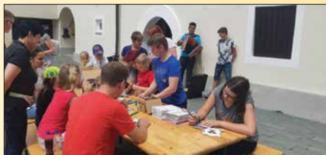
V Račah so se zabavali in uživali • Foto: Tamara Fordan