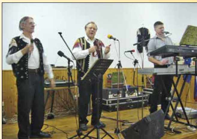
Glasbeni gostje - 'Jurovski gadi'

Naš zbor se je v sklepnem delu spremenil v družabno srečanje ob večerji in prijetni glasbi, za katero so poskrbeli 'Jurovski gadi'.