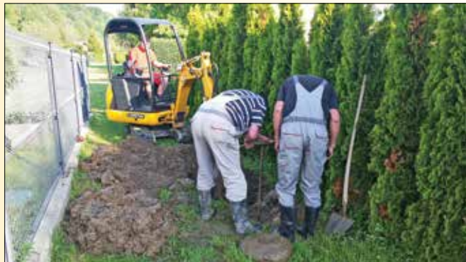
Odprava okvare na vodovodnem omrežju v Framu

Okvare na javnem vodovodnem omrežju v sklopu prizadevnih sodelavcev v režijskem obratu v veliki meri odpravljamo sprotno.