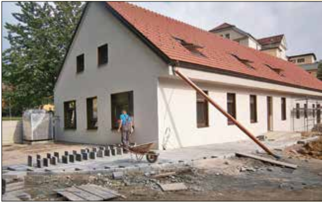
Nekdanji objekt gostilne Turner dobiva svojo novo podobo

Konec maja 2018, ko nastajajo te vrstice, lahko z zadovoljstvom napišemo, da nam s pomočjo predanih ljudi in pridnih rok na terenu uspeva slediti projektni časovnici, kar pomeni, da ključni mejniki navedene investicijske zgodbe niso ogroženi. Krajani pa lahko v tem času že spremljate novo, sodobno in lepo obleko objekta ter urejanje njegove okolice.