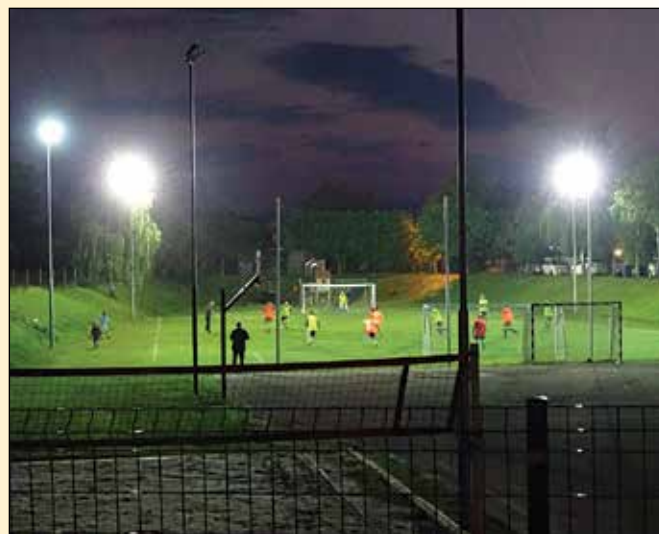
Na osvetljenem igrišču - pod reflektorji

Okrepčani smo nadaljevali z aktivnostmi na prostem. Tekme ekip (nogomet na travi, odbojka na mivki in nogomet na asfaltu) so imele dvojni sijaj – sijaj ponosa v nas in sijaj reflektorjev nad nami.