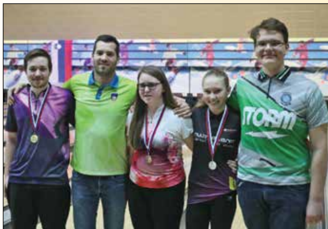
Mladinsko državno prvenstvo; posnetek mladinske reprezentance in reprezentančnega trenerja

Z novo sezono so na mladinskem državnem prvenstvu ukinili kategorijo do 15 let, ločeni smo bili le po spolu in vsi v eni kategoriji do 18 let. Takrat sem zasedla 2. mesto med mladinkami, sicer pa se ni dogajalo nič posebnega.