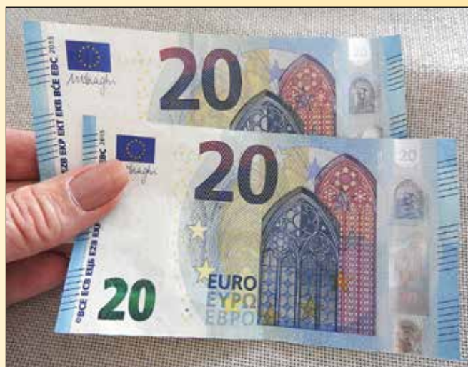
Tudi v šolskem/študijskem letu 2018/19 bodo upravičenci prejeli 40 EUR občinske žepnine mesečno (400 EUR v celotnem letu)

Upravičene vlagatelje prosimo, da z oddajo vlog ne prehitete in seveda z njimi tudi ne zamujate.