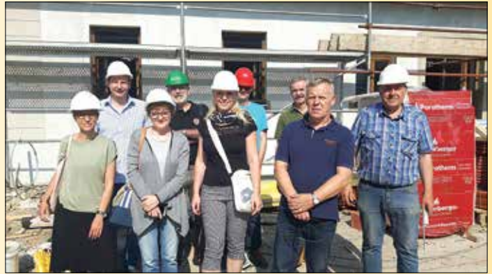
Ponosno pred objektom – predstavniki vseh sodelujočih pri investiciji

V poletnih mesecih je predvideno opremljanje objekta, ki se preko ceste spogleduje s stavbo OŠ Fram. Z namestitvijo notranje opreme nas bo kar nekaj, ki si bomo globoko oddahnili in nas bo navdajalo zadovoljstvo, da smo investicijo, kljub številnim vmesnim dogajanjem in zapletom, vendarle uspeli 'odkljukati', torej jo pravočasno in v vseh ozirih primerno pripraviti za novo šolsko leto in nove dogodivščine četrtošolcev, ki bodo gostovali v tamkajšnjih novih prostorih.