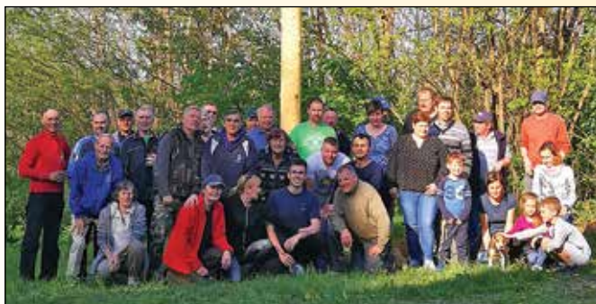
Skupinski posnetek postavljavcev letošnjega majskega drevesa v Kopivniku; pri domu krajanov

V počastitev mednarodnega praznika dela, 1. maja, konec aprila tudi v naši vasi tradicionalno postavimo majsko drevo. Pravzaprav pa pri nas nismo kar tako, saj postavimo kar dva mlaja; prvi svojo slovesno okrašeno konico visoko moli v zrak v Kopivniku, drugi pa se v višave vzpenja v Lokmircah.