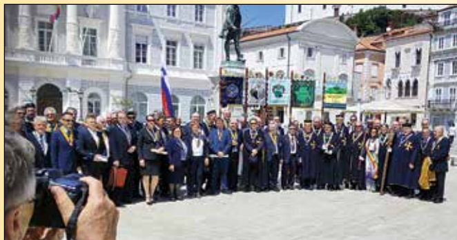
Skupinski pozdrav iz Pirana

Po maši so udeleženci pred cerkvijo oblikovali viteški krog in razglasili viteško vino za leto 2018. To priznanje je dobilo rdeče vino (Colja vino) istoimenskega vinogradnika iz Komna. Takega vina se lahko napolni le 1.000 steklenic.