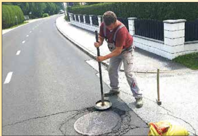
Sanacija udarnih jam s hladno asfaltno maso

Kot običajno, smo v marcu in aprilu opravili pregled občinskih cest ter pogodbenim izvajalcem naročili sanacijo mrežastih razpok in udarnih jam na asfaltiranih cestiščih, prav tako pa tudi popravilo bankin.