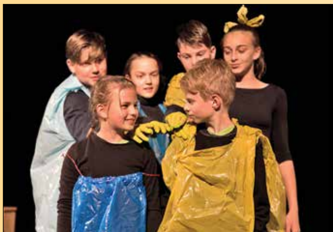
Mali modri in mali rumeni