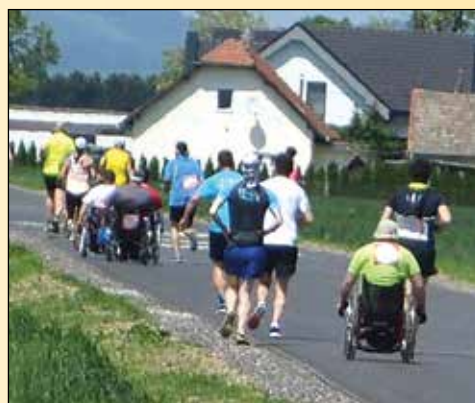
Med tekači so bili tudi udeleženci na invalidskih vozičkih