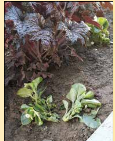
Polomljeno, pomendrano...; na zelenici pri gradu Rače, pomladi 2018