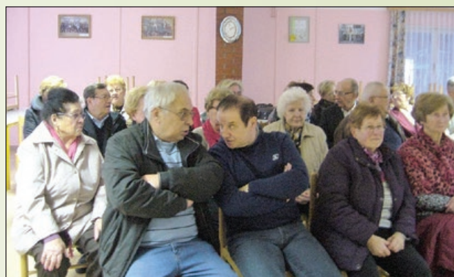
Del udeležencev prireditve

Ob zaključku prireditve je bila izrečena zahvala vsem nastopajočim in obiskovalcem, ki so se radi odzvali tudi povabilu k prijetnemu druženju ob čaju in pecivu.