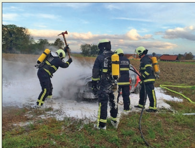
Praktične vaje - gašenje gorečega avtomobila

Prav tako smo nadaljevali z renoviranjem gasilskega doma; v letu 2016 smo popolnoma obnovili sanitarne prostore v pritličju. Le-ti so sedaj lepo in moderno urejeni, kar nas seveda veseli.