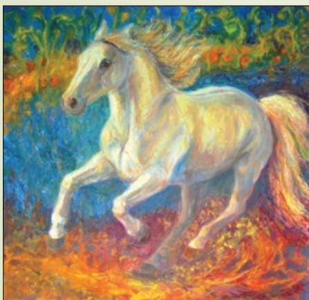
Jubiloso - olje na platno