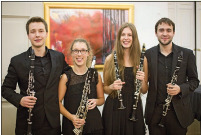
Kvartet klarinetov A vista na 1. abonmajskem - novoletnem koncertu, 8. 1. 2017

Oba koncerta je tonsko posnela RTV Maribor, za predvajanje na programu ARS.