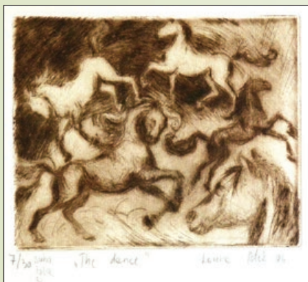
Ples - suha igla