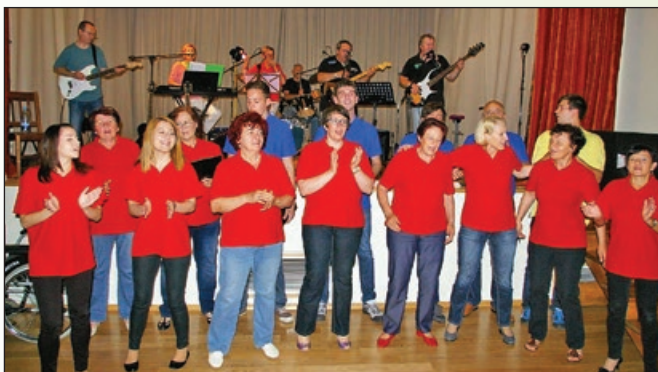
Vse mora biti točno tako, kot je dogovorjeno

Naenkrat je spet polno tistega pozitivnega adrenalina, obenem pa okoli tudi polno prijateljev, ki z nevsakdanjim leskom v očeh čakajo, katera pesem bo sledila. Glasovi in instrumenti ansambla Skrivnost dosežejo najlepši mogoč učinek, ko skoraj vsi prisotni v dvorani pritegnejo petju, brez not, brez besedil. Kako dobro znamo zapeti vsi skupaj, kako mogočno in povezano zveni! Kako tudi ne, saj gre vendar za pesmi naše skupne mladosti, ki še vedno zvenijo v naših spominih in v naših srcih!