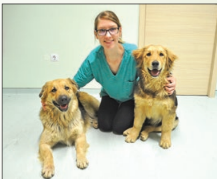
V službi vaših hišnih ljubljencekov