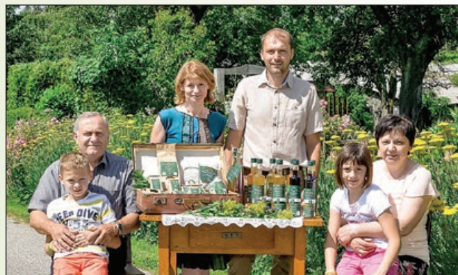
Družinski posnetek - tri generacije Uranjekovih

pri vsem je veselje do dela na kmetiji, ki ga imamo vsi.