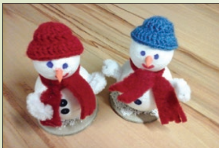
Unikatove ročnodelske pozornosti za člane DU Fram

V okviru letnega programa je društvo organiziralo novoletno praznovanje za člane: Na kmečkem turizmu Ačko se je ob tej priložnosti veselilo 49 članov. V lepem in prijetnem razpoloženju ter ob odlični glasbi so nas zopet razveselile članice 'Unikata', ki so vsem prisotnim razdelile lepa božična darilca.