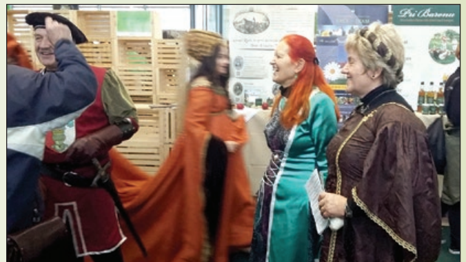
Utrip zgodovine ob našem razstavnem prostoru

V želji, da privabijo obiskovalce, se na sejmu predstavljajo različni liki v pisanih kostumih. Tako je naša zgodovinska zgodba pritegnila pozornost graščakov, dvorskih norčkov, planšarjev ipd., ki ravno tako kot mi predstavljajo zgodbo svojega kraja.