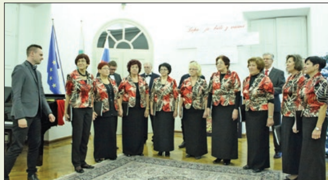
Utrinek s slovesnosti ob 70-letnici obstoja MePZ KUD Rače

17. 12. 2016 pa je naš mešani pevski zbor pripravil koncert ob 70-letnici obstoja.