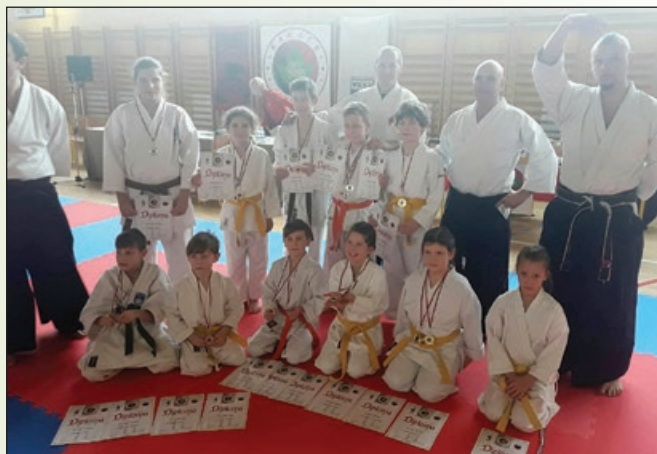
Bogatejši za nove izkušnje in medalje