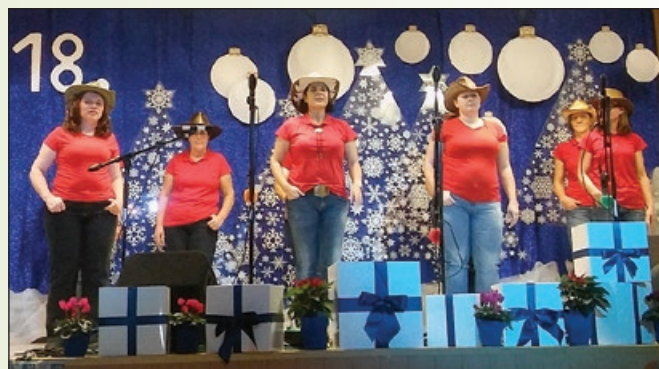
Plesna točka domačink