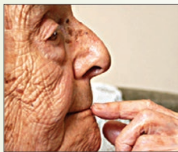
Življenjska doba se podaljšuje in med nami je/bo vse več starostnikov, potrebnih pomoči

Z ozirom na to podpiramo dejavnost pomoči na domu in smo odprti za vse koristne ter utemeljene predloge in sugestije; v kolikor jih prejmemo, nanje tudi reagiramo. To smo storili tudi v januarju 2017, ko je CPD, skupaj s podatki o čakajočih in potrebnem fondu ur, poslal predlog za zaposlitev dodatne socialne oskrbovalke v polovičnem deležu; še istega dne smo tovrstnemu predlogu ugodili, kar pomeni, da bodo v času branja tega zapisa za potrebe naših občanov na terenu že delale tri in pol (doslej tri)