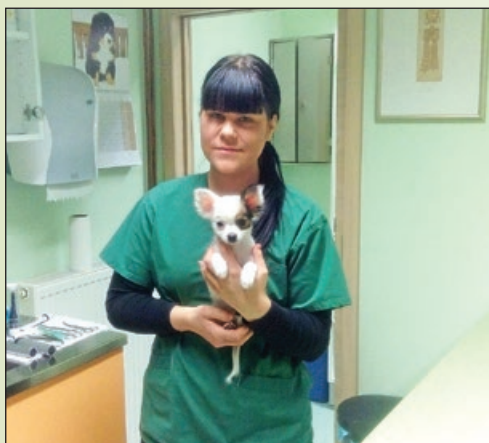
V veterinarski ambulanti strokovno pomagamo živalim

Prva pomoč hišnim ljubljencem naj se vedno začne s klicem veterinarja. Ta bo presodil, ali vaš ljubljencek potrebuje nujno in takojšnjo veterinarsko oskrbo ali ne. Zlasti pozorni bodite takrat, ko pride oziroma posumite na možnost zastrupitve (npr. s podganjim strupom), v kolikor je vaš ljubljencek zaužil tujek (npr. igračo, kamen), če je prišlo do opeklin, če je vašega ljubljenceka pičila kača ali pa opazite klinične simptome, kot so blede sluznice, obsežnejše krvavitve, huda vročina, nenadni živčni znaki oz. napadi, hude bolečine, krči, izguba zavesti, oteženo dihanje, otežen porod itd. V teh situacijah nujno najprej pokličite veterinarja ter mu čim bolj natančno opišite trenutno stanje vašega ljubljenceka. Nato sledite njegovim navodilom.