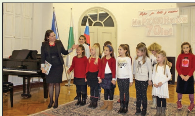
Otroški zbor OŠ Rače