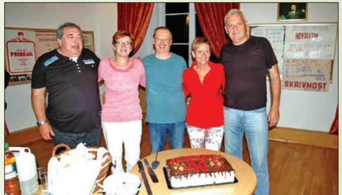
After party! Torta ob 40-letnici; praznovanje za člane ansambla Skrivnost in za njihove številne prijatelje se začenja!