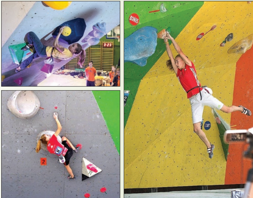
Levo zgoraj: Državno prvenstvo Kranj 2016 (disciplina balvani); doseženo 1. mesto na tekmi in v skupnem seštevku Levo spodaj: Evropski mladinski pokal Argentiere 2016, Francija - 4. mesto (disciplina balvani) Desno: Svetovno mladinsko prvenstvo 2015 - 6. mesto (disciplina balvani)

Moji uspehi so se nadaljevali tudi v sezoni 2016. V začetku lanskega decembra je v Kranju potekalo finale državnega prvenstva v športnem plezanju. V disciplini balvansko plezanje sem v kategoriji kadetinj na tekmi dosegla zmago, s čimer sem si zagotovila tudi 1. mesto v skupni razvrstitvi in s tem naslov državne prvakinje. To sezono (2016) sem se udeležila tekem evropskega mladinskega pokala, ki so bile v Avstriji, na Portugalskem, v Franciji in na Poljskem. Junija 2016 sem na tekmi evropskega mladinskega pokala v Grazu osvojila 3. mesto, kar so bile moje prve stopničke na mednarodnih tekmah. Podoben uspeh mi je za las ušel na tekmi v Franciji, kjer sem bila četrta. Zaradi doseganja dobrih rezultatov tudi na drugih tekmah evropskega pokala (v glavnem sem se uvrščala med prvih deset) sem bila na koncu v skupni razvrstitvi evropskega mladinskega pokala za leto 2016 na 6. mestu.