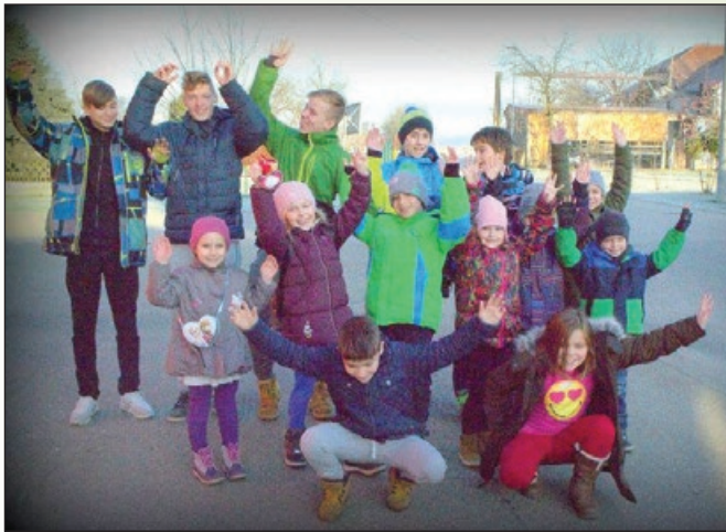
Naša gasilska mladina pred ogledom filma