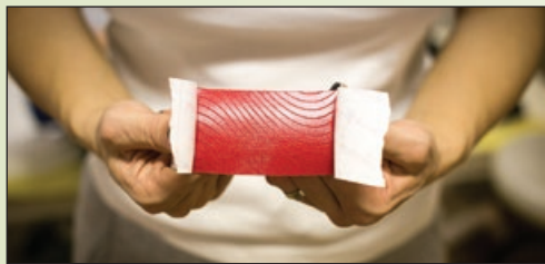
Lepilo je na trak naneseno v valovih, kar dopušča dihanje kože in znojenje