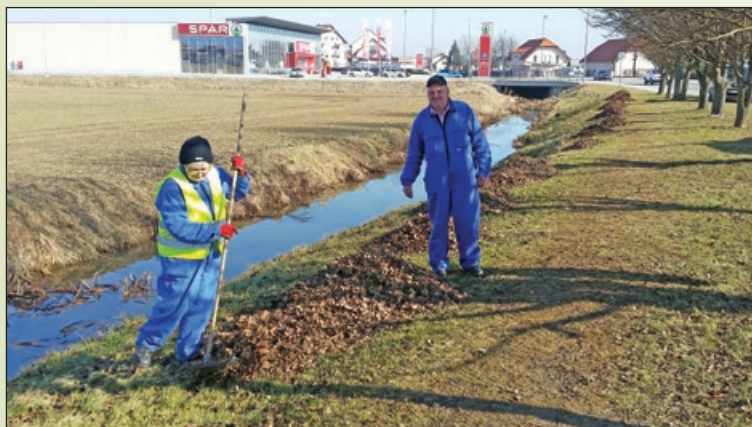
(Pred)spomladansko urejanje javnih površin

V spomladanskih mesecih bodo naporji usmerjeni v sanacije lokalnih in krajevnih cest, posvetili se bomo krpanju udarnih jam, mrežnih asfaltnih razpok, čiščenju in popravilu obcestnih bankin, gramoziranju makadamskih cest ter čiščenju obcestnih jarkov in prepustov.