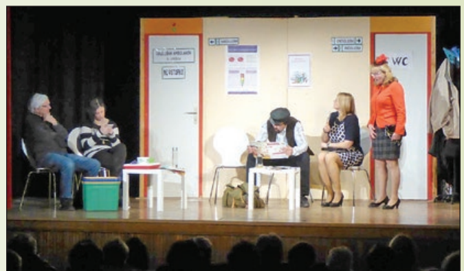
Nastop v Štandrežu - 'Pacienti v čakalnici'

Žal nam čas ni dopuščal še kakšnega ogleda, saj smo že morali pohiteti na italijansko stran, kamor smo bili pravzaprav namenjeni - namreč v kraj Štandrež oz. Sv. Andraž (Andrej), kjer je kulturni sedež naših zamejskih Slovencev, ki so po delitvi meje ostali na italijanski strani.