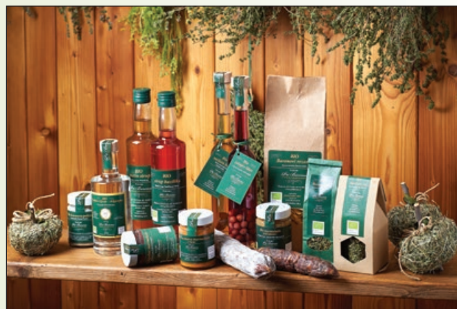
Pri Baronu - del ponudbenega asortimana

Z njimi prirejamo tudi razne dogodke (dneve odprtih vrat, festivale, kulinarična doživetja, ogleda, degustacije).