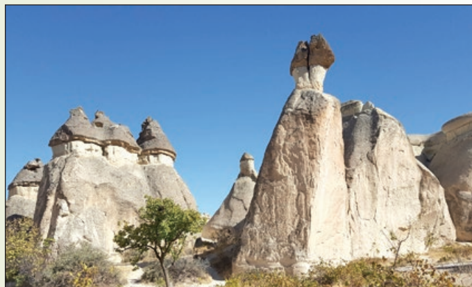
Tipična pokrajina v Kapadokiji

Ta izjemno lep nacionalni park pa ne privablja le turistov, temveč v zadnjih letih tudi tekače. Že četrto leto zapored domačini organizirajo trail festival, ki je lani potekal 22. in 23. oktobra. V okviru tekme Salomon Cappadocia Ultratrail so bile tekmovalcem na voljo tri različne proge in sicer na 30, 60 in 110 km.