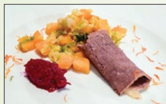
Pohorje beef po Baronovo

Naša hiša je zdaj res najbolj poznana po naši hišni specialiteti - govedini 'Pohorje beef', ki jo pripravljamo na prav poseben, Baronov način. Obiskovalci so nad njo navdušeni; še več: nekateri se vračajo ravno zaradi te dobrote. Recept naj ostane skrivnost, si pa, kar seveda enako velja za vse bralke in bralce, povabljen na pokušino. Posebnost naše kmetije in pika na i celotni ponudbi pa so tudi avtohtone zimske tepke, kuhane v vinu in metu ter polite z jurkino omako. Se kar sline pcedijo!