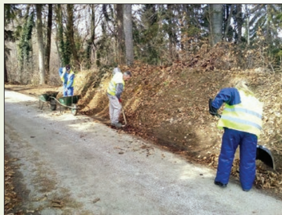
Čiščenje obcestnih muld

Navedena opravila bi v režijskem obratu radi, v skladu z možnostmi, zaključili pred močnejšimi padavinami (obilnega deževja, kakršno nas je zajelo sredi lanskega leta, si seveda ne želimo, saj je povzročilo veliko materialno škodo).