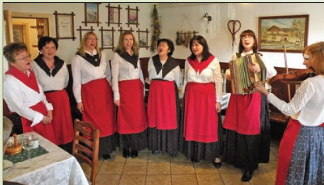
Veselo je bilo tudi 'Pri Baronu'

Še kdo dvomi, da je glasba nekaj čudovitega, navduhujočega in povezujočega?