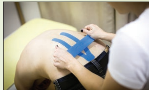
Prikaz nameščanja elastičnega lepilnega traku pri bolečini v križu