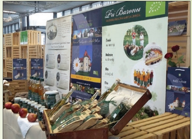
Predstavitve ponudbe kmetij 'Pri Kovačniku' in 'Pri Baronu'

Zgodbe so tiste, ki privabljajo in turistično destinacijo dodatno bogatijo. Z veseljem in ponosom smo obiskovalcem približali zgodbo prvega slovenskega zgodovinskega romana izpod peresa Josipa Jurčiča - Ivan Erazem Tattenbach.