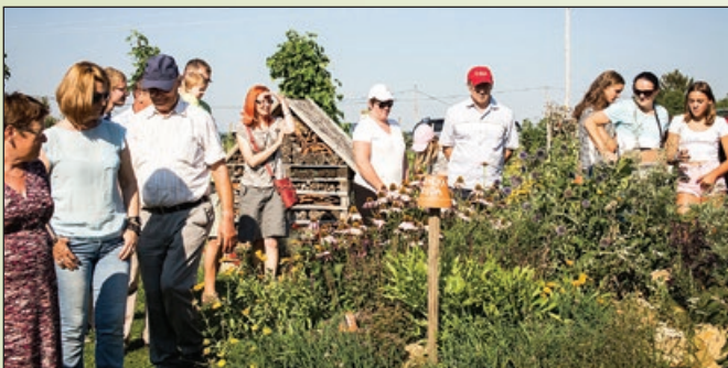
Na enem izmed vodenih ogledov Uranjekovih vrtov

Za odrasle pa pripravimo razne ogledne, degustacije, izobraževalne programe in kulinarična doživetja. Zaradi vsega tega se oboji radi vračajo v vseh letnih časih.