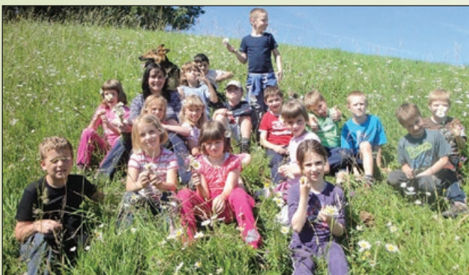
Živali na kmetiji in naravno okolje - nevsakdanja dogodivščina za otroke 21. stoletja

Za odrasle pa pripravimo razne ogledne, degustacije, izobraževalne programe in kulinarična doživetja. Zaradi vsega tega se oboji radi vračajo v vseh letnih časih.