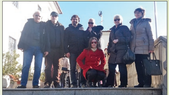
Pred samostanom Kostanjevica pri Novi Gorici

Naslednji dan smo si ogledali samostan Kostanjevico. Velika, impozantna stavba s cerkvijo je kar vabila na ogled.