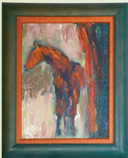
Konj - olje na lesenit

Najljubši motiv njenih del je konj, ki v svoji podobi nosi najrazličnejše simbolne pomene, kot so svoboda, plemenitost, življenjska moč, pogum, drznost, lepota... Njeni konji so svobodni, pogosto pravljичni ali mitološki.