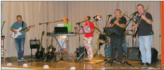
Pa se je začelo - koncert Skrivnosti

Naposled nastopi prav poseben petek, 10. junija 2016, ko se vse 'poklopi'.