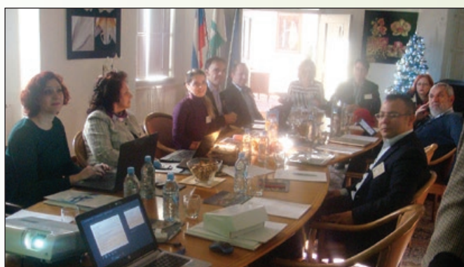
Del omizja z gosti iz drugih evropskih držav

V sredini decembra smo (pod okriljem Pozejdon turizma d.o.o. iz Rač in ob gostoljubju Občine Rače-Fram) v treh dneh kolegom iz različnih evropskih držav predstavili našo domačo destinacijo.