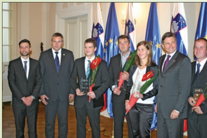
Utrinek s podelitve naziva IMK 2016