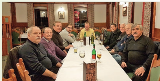
Iz ustanovnega sestanka skupine, 5. 1. 2017