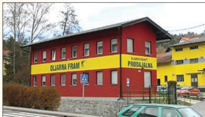
V Sloveniji ni oljarne, ki bi imela daljšo tradicijo od Oljarne Fram

Oljarna Fram je najstarejša slovenska oljarna. Prav letos ponosno obeležuje 270 let delovanja.