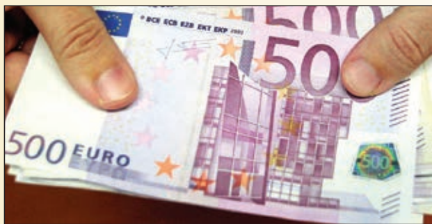
Občinska žepnina tudi v šolskem/študijskem letu 2020/21 znaša 50 EUR mesečno oz. 500 EUR na letni ravni

Dodeljevanje žepnin na tak način in v tolikšnem obsegu predstavlja edinstveno pravico, ki je vrstniki naših dijakov in študentov iz drugih lokalnih okolij niso deležni.