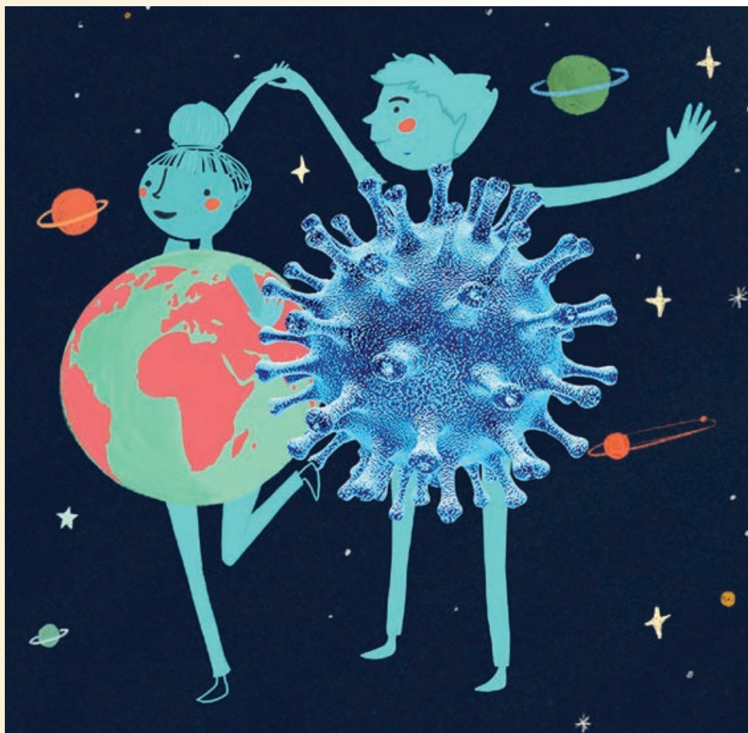
Resničnost in rdeča nit poslavlajočega se zgodovinskega leta 2020 skozi karikaturu 'Svet in mi v primežu koronavirusne bolezni COVID-19'

VIRUS JE ŠE VEDNO PRISOTEN MED NAMI. BODIMO PREVIDNI IN ODGOVORNI!