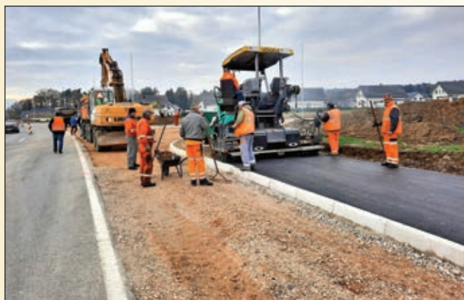
Asfaltiranje mešane površine za pešce in kolesarje ob Bistriški cesti v Morju

V zvezi s tako pričakovano izvedbo izvennivojskega križanja (podvoza) državne ceste z železniško progo v Račah smo v fazi potrditve idejne zasnove. Sedaj je na potezi Ministrstvo RS za infrastrukturo, ki je naročilo izdelavo dokumentacije za pridobitev gradbenega dovoljenja. Seveda si zaradi velike frekvence vozil skozi naselje Rače močno prizadevamo, da bi do realizacije projekta prišlo v doglednem času.