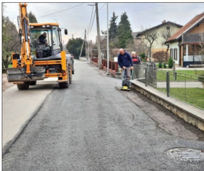
Urejanje bankin – Ješenca

Obseg vzdrževalnih del se iz leta v leto povečuje, saj kanalizacijsko in vodovodno omrežje zaradi potreb občanov vsakoletno širimo, obenem pa je komunalna infrastruktura na posameznih odsekih tudi dotrajana. Predvsem v hitro rastočem Morju je ostalo nekaj območij, kjer je potrebna izgradnja kanalizacijskega omrežja za odvajanje odpadnih vod. Na osnovi pridobljenega gradbenega dovoljenja za izgradnjo javnega kanalizacijskega omrežja na širšem območju naselja Morje