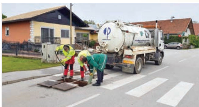
Čiščenje črpališča (pričujoči posnetek ni nastal na območju občine Rače-fram; op. ured.)

Pri svojem delu upravljavci kanalizacijskih sistemov evidentirajo vse večjo onesnaženost fekalne odpadne vode s predmeti oz. tujki, ki v kanalizacijo nikakor ne sodijo.