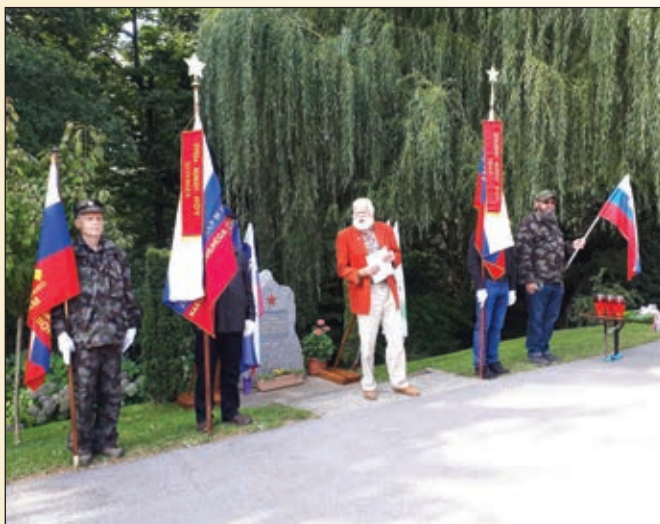
Spominska slovesnost na Jugovi domačiji