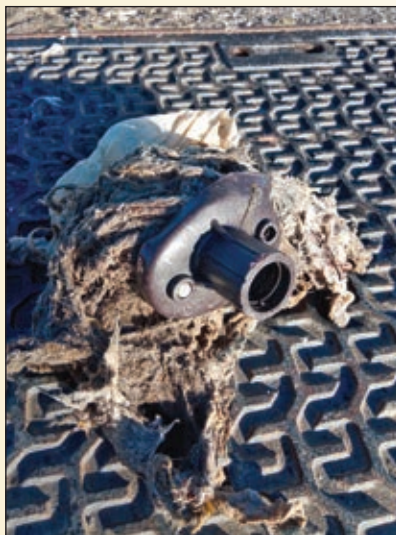
V kanalizaciji se najdejo tudi takšni predmeti

Sploh ob dejstvu, da imamo vzpostavljen ločen sistem zbiranja in odvoza odpadkov, so zamašitve kanalizacijskega sistema s tovrstnimi predmeti nerazumljive in nedopustne. Za namen odvoza tovrstnih odpadkov imamo vzpostavljen zbirni center, zato vas znova prosimo za odgovorno in pravilno ravnanje z odpadki.