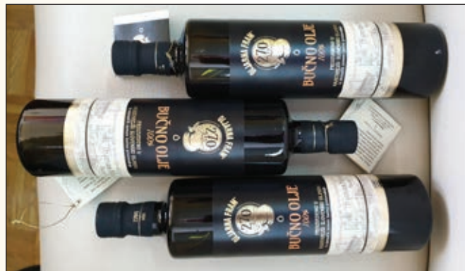
Privlačna podoba steklenic z bučnim oljem Oljarne Fram

Predmet investicije je obnova (investicijsko vzdrževalna dela) in ureditev prostorov objekta stare oljarne v Framu v muzej oljarstva in v promocijsko degustacijski prostor ter trgovino lokalne ponudbe.