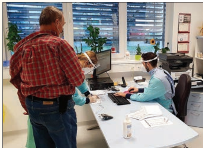
Utrinek z akcije cepljenja proti gripi, 21. 11. 2020

Cepljenje je potekalo v ZP Rače v dveh terminih in sicer v soboto, 7. novembra 2020, od 7.50 do 19.30 in v soboto, 21. novembra, od 7.50 do 16. ure. V obeh terminih je bilo cepljenih preko 800 ljudi.