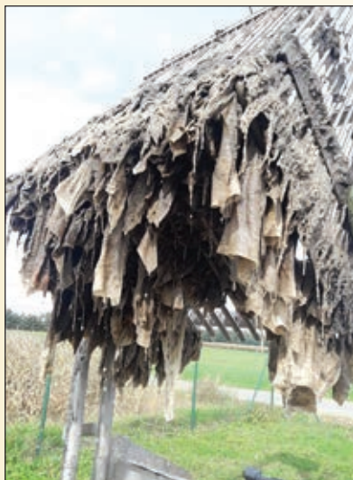
Vlažilni robčki v črpališču na čistilni napravi

Uporabnike kanalizacijskega sistema pozivamo, da naštetih predmetov oz. tujkov ne mečete v kanalizacijo, saj čiščenje in odmaševanje črpališč in cevovodov povzroča dodatne stroške, ki jih ne bi bilo, če bi v kanalizaciji bila le fekalna voda, ki ji je kanalizacija namenjena.