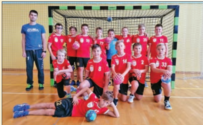
Mlajši dečki A in B, sezona 2020/21

Sezono 2020/2021 smo z veliko optimizma in pod strogimi ukrepi pričeli avgusta. Želeli smo si, da čim dlje treniramo in tekmuje, čeprav smo vedeli, da bo vsega lepega enkrat konec.