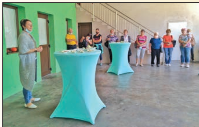
Obisk Oljarne Dajč

Po kratkem postanku smo se z avtobusom odpeljali na ogled Oljarne Dajč, družinskega podjetja, katerega sedež je prav tako v Rogaševcih. Z oljarstvom na tradicionalen način se tam ukvarja že več generacij, ki iz roda v rod izboljšujejo tehnologijo in kakovost njihovih produktov. Začetek predelave bučnega olja in nabiranje izkušenj segajo že v leto 1853, ko so z dejavnostjo v mlinu pričeli njihovi predniki. Danes v oljarni lahko okusite in kupite 100 % naravno bučno olje, bučna semena z različnimi okusi čokolad in začimb. Tudi mi smo degustirali njihove izdelke, bili nad njimi navdušeni in jih nekaj seveda tudi kupili za domov.