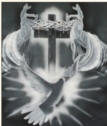
Ivo As in nekaj njegovih razstavljenih slik