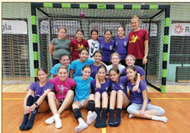
Mlajše deklice A in B

Sezono 2019/2020 smo končali sredi marca in do tedaj dokaj uspešno tekmovali. Kar nekaj naših deklet je tekmovalo za članice ŽRK Branik, ki so na koncu zasedle 4. mesto v 1. B ligi. Mladinke so bile na koncu neuradno 12. v državi, kadetinja so po 14-ih krogih (od 18-ih) zasedle 7. mesto v državi. Starejše deklice A bi morale še igrati razigravanje za 13. do 17. mesto v državi, starejše deklice B pa za 13. do 14. mesto. Največjo smolo so imele mlajše deklice B, ki so igrale odlično in se uvrstile med najboljših šest ekip v Sloveniji. Žal niso imele možnosti, da bi sezono odigrale do konca.