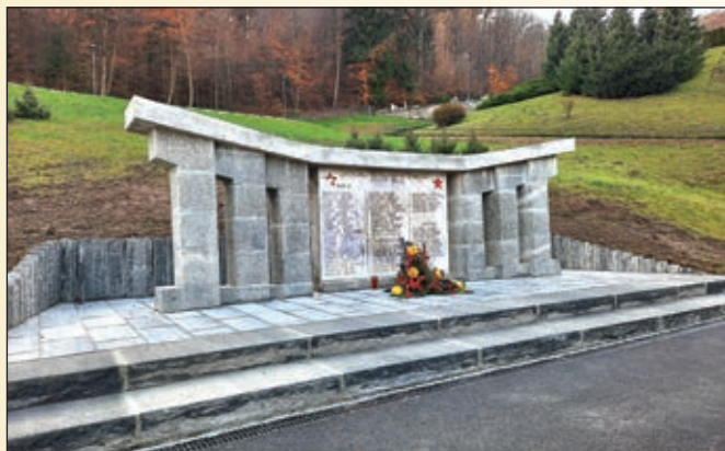
Prestavitev obeležja NOB izpred OŠ Fram na območje pokopališča v Framu

Podjetje za gozdne gradnje in hortikulturo d.o.o. je oktobra zaključilo izvedbo dodatnih grobnih polj in ureditvijo manipulativnih površin na pokopališču v Framu. Isto podjetje je izvedlo tudi prestavitev spominskega obeležja NOB izpred OŠ Fram na območje framskega pokopališča.