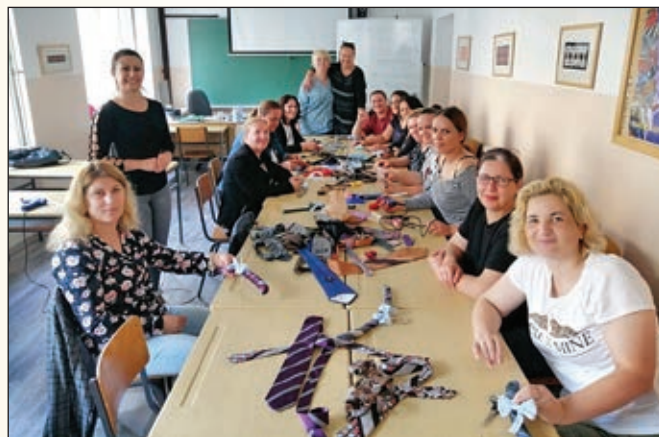
Utrinek z ustvarjalne delavnice ponovne uporabe materialov