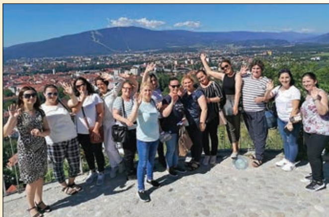
Na potepu po Mariboru: spoznavanje mestnih znamenitosti

V skladu s kriteriji uspešnosti so se udeleženke izkazale kot urejene, zanesljive in delovno učinkovite: znale so slediti navodilom za delo in so hitro usvojile delovne postopke, hkrati pa so izboljšale znanje slovenščine in postale samozavestnejše. Nekatere so se na osnovi pridobljenih izkušenj po izhodu iz programa SA tudi zaposlile kot čistilke.