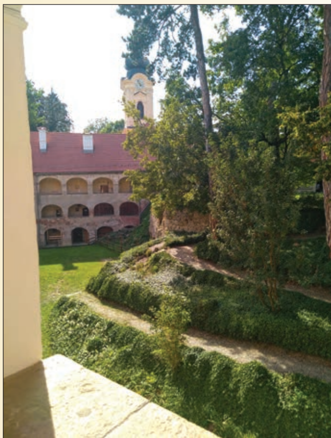
Grad Grad na Goričkem

Tamkajšnje grajsko poslopje spada med najobsežnejše komplekse na Slovenskem. Ozemlje okrog današnjega gradu je vključil v madžarsko državo kralj Bela III. in ga leta 1183 podaril cistercijskemu samostanu v Monoštru. Kmalu je prešlo v last različnih madžarskih fevdalnih rodbin, ki so nepretrgoma gospodarile na območju od Grada, tedanje Gornje Lendave, pa vse do Murske Sobotice. Grad je prava posebnost, saj najprej preseneti nenavadna oblika notranjega dvorišča z višjim zahodnim in nižjim vzhodnim nivojem, kar je posledica oblike grajskega hriba. V gradu so ogromne kleti in ječe. Tam se v obnovljenih sobanah nahaja še priljubljeni prostor zaljubljenih parov - poročna dvorana, v adaptiranih prostorih pa je ponovno nameščena tudi muzejska zbirka predmetov z gradu in okolice, ki je bila vrnjena v letu 1972.