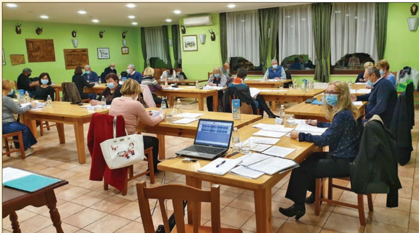
V razmerah, ko je pomembno, da nosimo obrazne zaščitne maske in ohranjamo varno razdaljo, seje OS Občine Rače-Fram potekajo v prostorih Lovskega doma Rače; posnetek je s 13. redne seje (v objektiv ni bilo mogoče zajeti vseh prisotnih), v sklopu katere je bil (med drugim) soglasno potrjen tudi občinski proračun za leto 2021

Občinski svet Občine Rače-Fram je Odlok o Proračunu Občine Rače-Fram za leto 2021 sprejel na svoji 13. redni seji, ki je bila 27. 11. 2020.