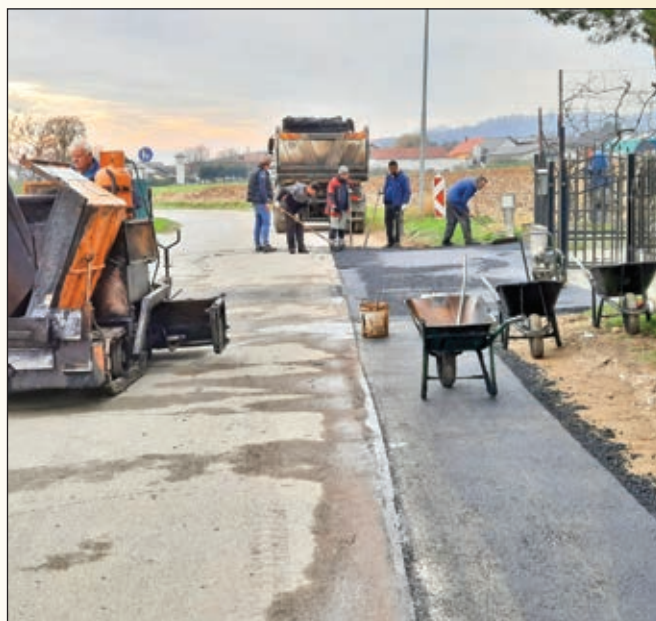
Sanacija in širitev vozišča po položitvi komunalnih vodov v Ješenci

Gradbena dela, vezana na izvedbo komunalne infrastrukture s širitvijo vozišča v delu naselja Ješenca, so bila s strani glavnega izvajalca (podjetja Predan d.o.o.) zaključena v novembru.