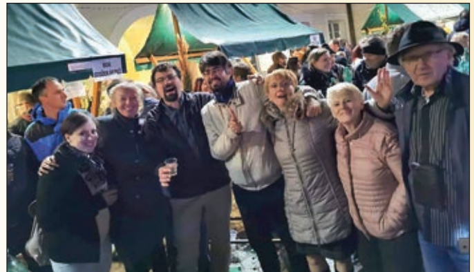
Spomin na martinovanje 2019, ko smo se lahko brez omejitev družili, zabavali, objemali...