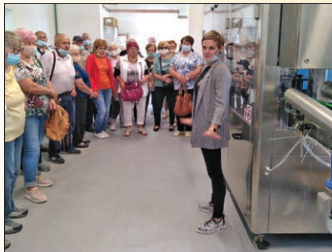
Polnilnica naravne vode Cana Royal Water

(Cana Royal Water) in slednjo tudi pokušali. Na območju kraja Nuskova so vaščani že pred več kot stoletjem ugotovili, da se na določenih predelih kraja pod zemljo nahaja mineralna voda, ki so jo poimenovali 'Slatina'. Ze pred drugo svetovno vojno so postavili polnilnico, kjer so 'Slatino' polnili in z njo oskrbovali ljudi na področju Slovenije in Avstrije. Leta 2010 so od Občine Rogaševci odkupili takratno šolo, ki je datirala v leto 1900. Po dolgem čakanju so septembra 2016 prejeli koncesijo in pristopili k pridobivanju gradbenega dovoljenja. Natanko leto dni kasneje je bil objekt pripravljen za polnjenje mineralne vode.