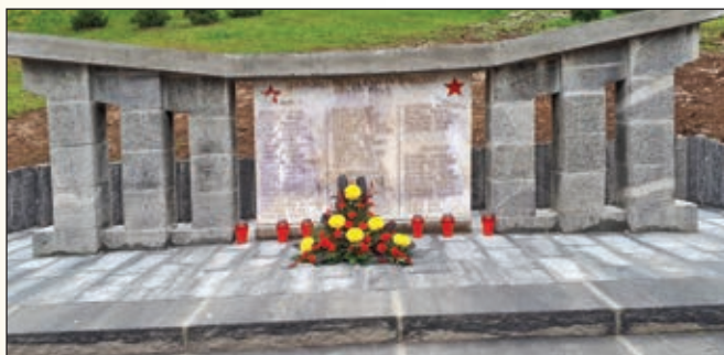
Prestavljen centralni spomenik; pokopališče v Framu

Izkoriščam priložnost in seznanjam občane, ki tega morda še ne vedo, da je centralni spomenik, ki je bil prej lociran pred OŠ Fram, v avtentični postavitvi prestavljen na nadomestno lokacijo in sicer na framsko pokopališče, v bližino mrliške vežice.