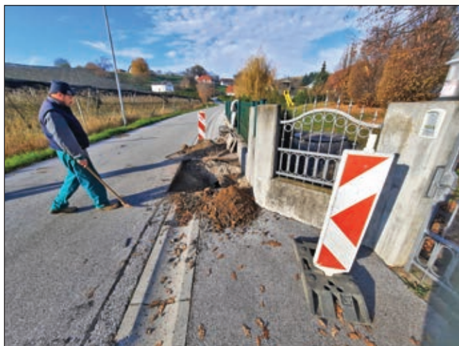
Sanacija meteornih kanalov v Framu - Varta

V drugi polovici letošnjega leta smo imeli 'odprtih' kar nekaj gradbišč, vezanih tako na vzdrževalna kot tudi na investicijska dela.